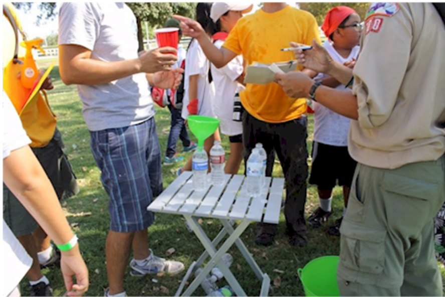
Ảnh # 1983: các Trưởng đang xem đội nào hứng được nhiều nước nhất?