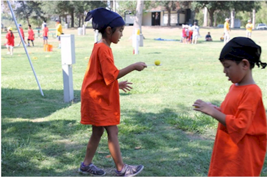
Ảnh # 2060: các em đang vừa chơi, vừa học sự kiên nhẫn