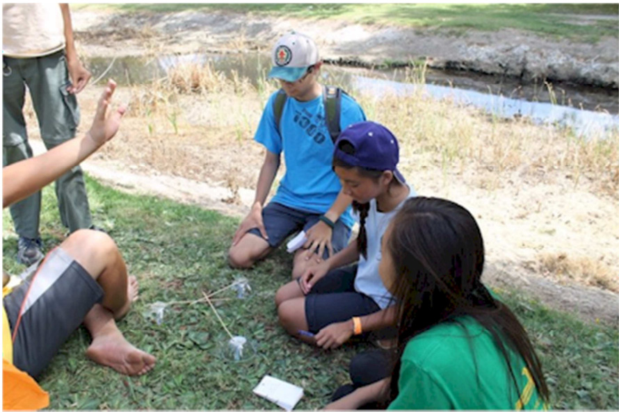
Ảnh # 2482