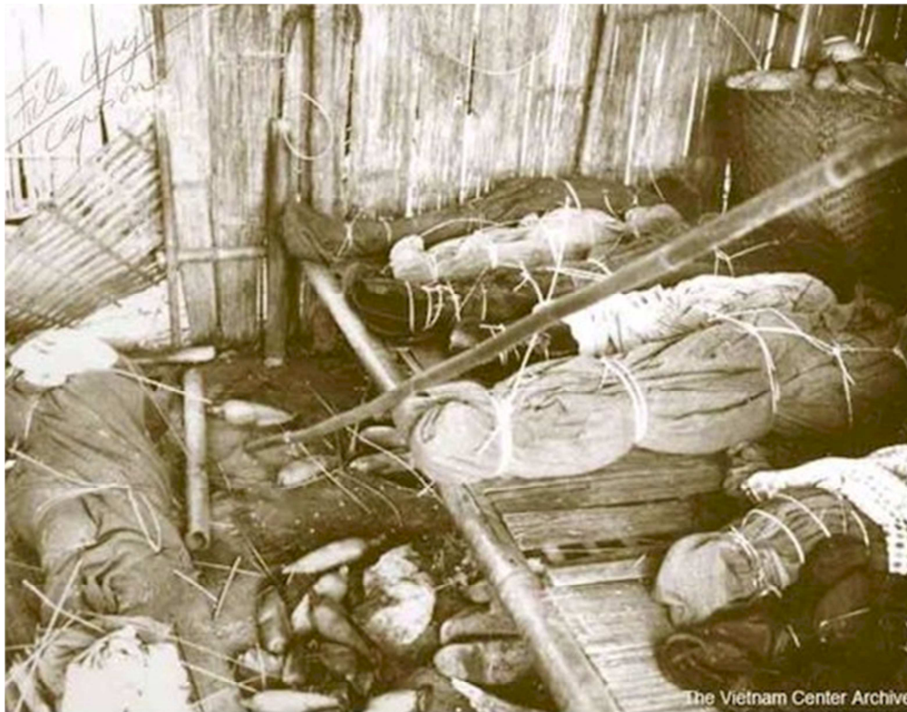
Dak Son Massacre - Bodies wrapped in available material await burial in one of the few remaining huts. These bodies were removed from a tunnel shelter.

Tổng cộng 252 dân làng đã bị giết trong cuộc tàn sát này, đa số là đàn bà và trẻ em.