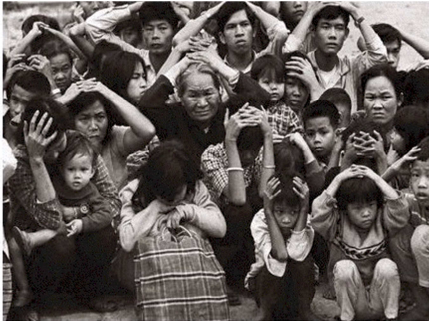
Việt Cộng tập trung đồng bào Huế để tìm bắt quân nhân và công chức VNCH

Trong 28 ngày chiếm giữ Huế, bọn Việt Cộng (bộ đội Bắc Việt và quân đội Giải Phóng Miền Nam) ngày nào cũng đi lùng bắt giết các quân nhân VNCH nghỉ phép về nhà ăn Tết và viên chức của VNCH. Những người dân thường không theo chúng, chúng cũng bắt và giam giữ tại nhiều nơi khác nhau. Số người bị bắt giam vào khoảng gần 10,000 người.