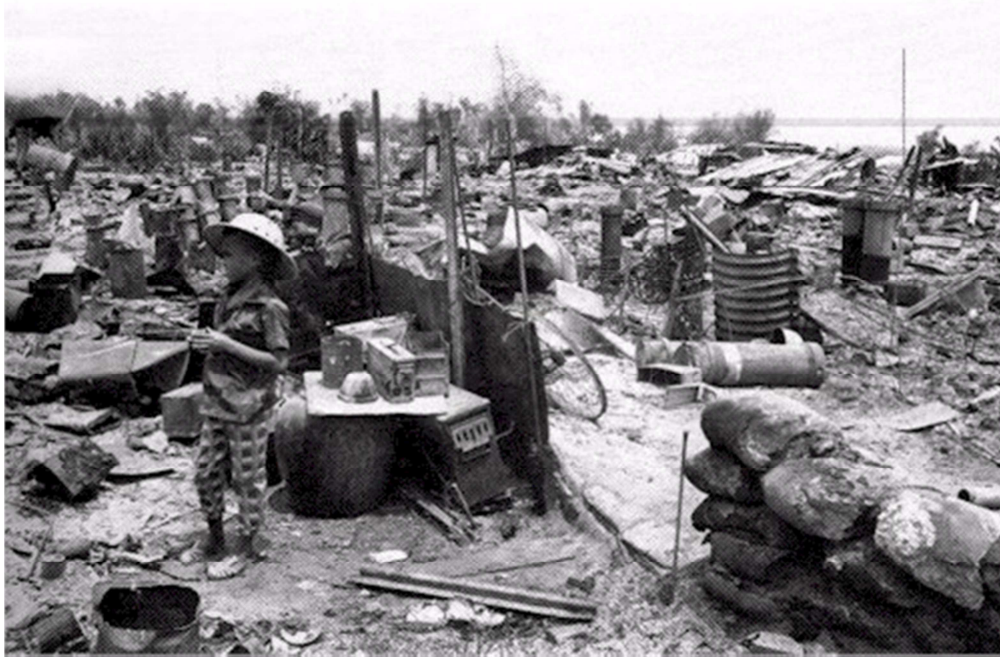
Làng Dục Đức sau ngày 28-31/3/71