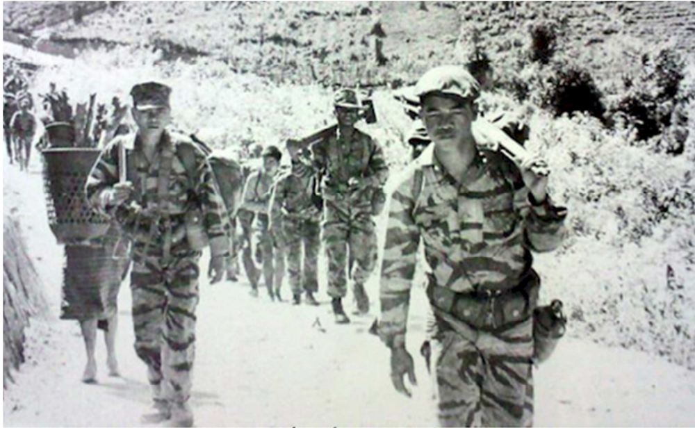
Một đơn vị Dân Sự Chiến Đấu (CIDG) của trại biên phòng

Thì ra, không ai dám chia với bác C ấy. Ba tôi kể, bác C ấy làm “ăng-ten” cho cai tù CS và ăn hiếp bạn tù, nên mọi người đều ghét và sợ va chạm với nhân vật này. Với ai, chớ với ba tôi thì nhân vật này không dám đụng tới vì ông ta biết rằng ba tôi gốc LLDB, gan dạ, liều lĩnh, nói là làm. Ba tôi đã đòi hỏi phần của mình. Cuối cùng, chính nhân vật này phải cắt cục xà bông đưa cho ba tôi. Ba tôi thường dạy chúng tôi rằng, “Mình không nên ăn hiếp người yếu hoặc thấp nhỏ hơn mình. Ngược lại, nên bảo vệ cho họ.” Đúng vậy, khi ở tổ ra rừng đốn củi, ông thường dành khiêng phần gốc cây để phần ngọn nhẹ cho bạn tù.