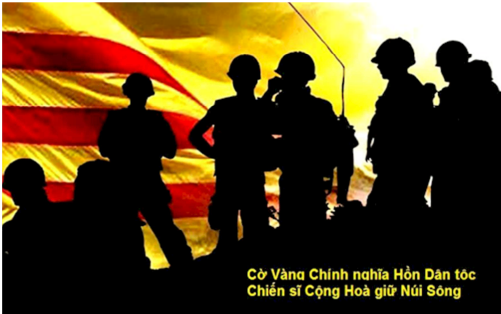
Cờ Vàng Chính nghĩa Hồn Dân tộc Chiến sĩ Cộng Hoà giữ Núi Sừng