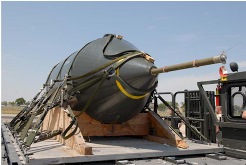
Bom CBU BLU-82

nặng 7 tấn, đã được dùng trong cuộc Hành Quân Lam Sơn 719 tại Hạ Lào để dọn bãi đáp cho trực thăng. Tôi có tìm hiểu thì thấy rằng hầu hết các bài viết trên báo của Việt cộng đều nói rằng, hoặc quả quyết rằng, loại BLU-82 đã được dùng tại Xuân Lộc. Tại sao họ phải nói như thế?