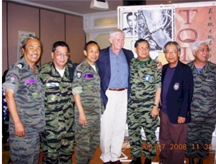
Trâu Điền Cương, Phán, Cấp, Hoar, Đồ Sơn, Dzoan, Cự