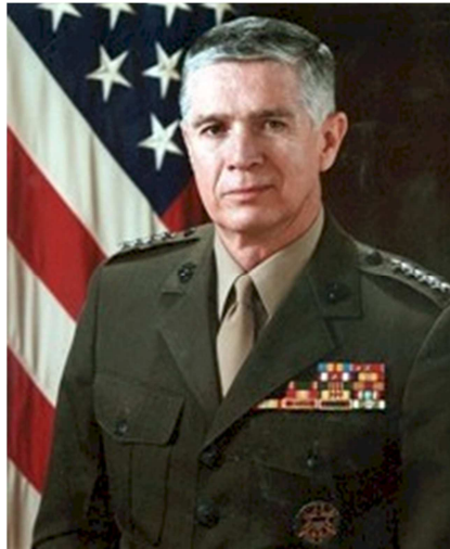
Gen Joseph Hoar

Chẳng phải vì “thấy sang bắt quàng làm họ” mà tôi đưa hình hai vị tướng 4 sao vào bài viết này, mà chính quý vị ấy đã nhận mình là “Trau Dien” và đến với chúng tôi như những “đồng đội” gần nửa thế kỷ về trước, dù ngày nay chúng tôi là những quân nhân bị “gãy súng”. Quý vị ấy đã đến với chúng tôi như nước Mỹ đã mở rộng vòng tay đón chúng tôi. Đó cũng là lý do tôi chọn tựa đề cho bài viết này là “Trâu Điền Và Cố Vấn Mỹ, dù muộn nhưng vẫn phải nói”, nói để cảm ơn quý vị đã anh dũng chiến đấu và hy sinh bên cạnh Trâu Điền nói riêng và Binh Chủng TQLC/VN nói chung. Đã có tới 5 vị Cố Vấn hy sinh bên cạnh các tử sĩ TQLC/VN và hầu như CV nào cũng bị thương. Bây giờ tôi xin tiếp tục hỏi thăm tin tức về các CV khác: