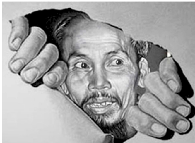
Hồ Chí Minh: Tội Đồ Dân Tộc – Thủ Phạm Bán Nước!

LTG: Chuyện thật như đùa là ở Việt Nam ngày nay, có những kẻ mang tượng Hồ Chí Minh vào chùa cho bá tánh tôn thờ. Dĩ nhiên điều này đã bị nhiều Phật tử hay những người tử tế lên tiếng phản đối, nhưng cũng không ít những tên bồi bút cho rằng đức tượng ông Hồ và mang vào những nơi thờ tự của tôn giáo để mọi người “chiêm ngưỡng” là “phải đạo”. Đúng là miệng lưỡi của ma quỷ.