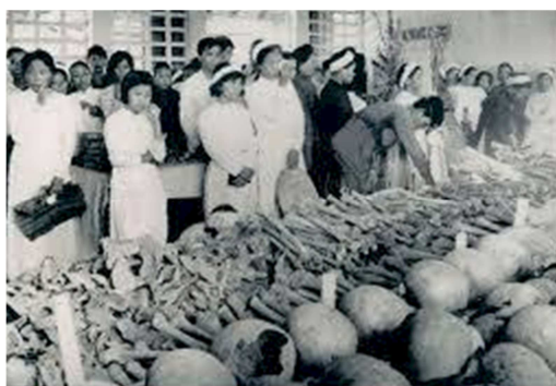
Hình: Tội ác Hồ Chí Minh và đảng VC

Ở đời này có nhiều điều nghịch lý, nhưng cái điều nghịch lý mà người lương thiện, đạo đức không thể làm ngơ. Đó là: Một tên đại gian ác như Hồ Chí Minh (HCM) lại trở thành “thần tượng” của nhiều người. Họ thần tượng đến nỗi đúc tượng để thờ ông Hồ như người có tín ngưỡng tôn giáo thờ một “Ông Thánh” nào đó.