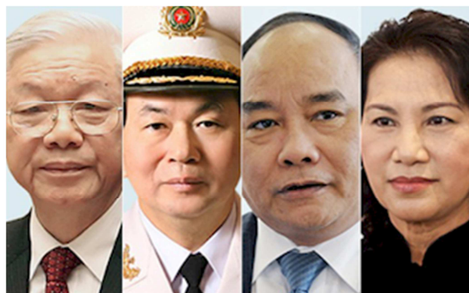
Hình: Bọn này hiện nay tiếp nối công việc bán nước hại dân của Hồ Chí Minh

Ngày nay bọn VC không ngần ngại mang từng mảnh đất của Cha Ông để lại lần lượt dâng hiến cho quan thầy Trung Cộng. Những năm qua, người dân tại Việt Nam không có quyền lên tiếng bày tỏ lòng yêu nước khi nhìn thấy sự xâm lấn của kẻ thù phương Bắc. Đảng cướp VC là một bọn người mà tôi không ngần ngại gọi là “khôn nhà dại chợ”. Tôi căn cứ vào những phản ứng của bọn chúng trong thời gian qua, chung quanh vấn đề “bauxit Tây Nguyên”, và vấn đề ngư dân Việt Nam bị hải quân Trung cộng bắt bớ, đánh đập tàn tệ ngay trên lãnh hải Việt Nam mà VC không dám bênh vực; để cho bọn Tàu cộng đặt giàn khoan dầu ngay trên lãnh hải Việt Nam, cho công ty Formosa thả chất độc xuống biển miền Trung, mà chúng không dám mở miệng nói một lời phản đối rõ ràng... để tôi khẳng định tụi VC “hèn với giặc, ác với dân” như người trong nước ta thán.