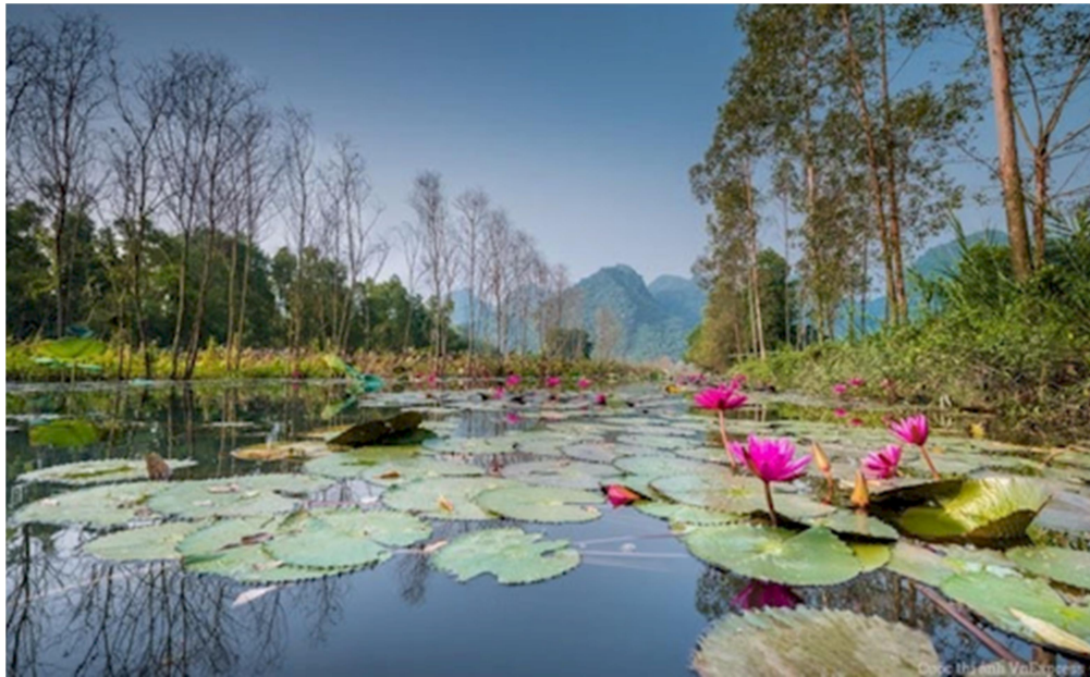
Suối Yến gần chùa Hương vào mùa Thu

Người lên ngựa kẻ chia bào Rừng phong thu đã nhuốm màu quan san Dặm hồng bụi cuốn chinh an Người đi đã khuất mây ngàn dâu xanh Người về chiếc bóng năm canh Kẻ đi muôn dặm một mình xa xôi.