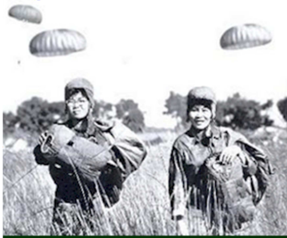
HÌNH ẢNH: NỮ QUÂN NHÂN DÙ QLVNCH