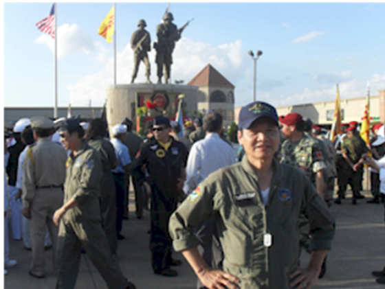
Ảnh: tác giả THÀNH GIANG, Cơ phi vận tải C-119, C-47 và C-7A CARIBOU

Ghi Chú: Tác giả là người Không quân viết bài này trong lĩnh vực Nhảy dù, với mục đích GIẢI TRÍ nếu có những sự sai sót, ngoài ý muốn, xin quý độc giả vui lòng sửa chữa và niệm tình tha thứ. Chân thành cảm ơn.