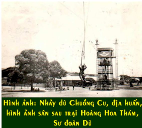
HÌNH ẢNH: NHẢY DÙ CHUỒNG CU, ĐỊA HUẤN, HÌNH ẢNH SÂN SAU TRẠI HOÀNG HOA THÁM, SƯ ĐOÀN DÙ

Ngoài các giai đoạn học tập căn bản quân sự. Các quân nhân Nhảy Dù phải qua các giai đoạn huấn luyện nhảy dù và lấy bằng. Giai đoạn 1: thực tập nhảy dù dưới đất, địa huấn, chúng ta thường nghe nói học “nhảy dù chuồng cu”, bãi nhảy dù thực tập “chuồng cu” nằm ở sân sau Sư đoàn Dù của trại Hoàng Hoa Thám, trong phi trường Tân Sơn Nhứt. Các quân nhân Dù phải tập nhảy và cách té nhuần nhuyễn với những thế nhảy “hạ thổ” an toàn, tránh bị gãy chân gãy tay, bị thương tật, trước khi qua học giai đoạn 2, nhảy dù thực sự trên không từ các loại phi cơ vận tải, lấy bằng và hưởng lương nhảy dù, để trở thành những người lính Nhảy Dù chuyên nghiệp.