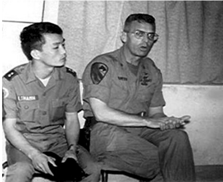
Trung úy Trưởng Ty CSQG Liên Thành và Tướng Tư Lệnh Sư Đoàn Kỵ Binh Không Vận Hoa Kỳ (phải)

Trưởng ty CSQG Liên Thành phối hợp với Cố Vấn Mỹ trước giờ xuất phát