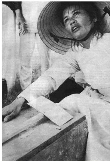
Nạn nhân Cộng Sản Tết Mậu Thân, 1968