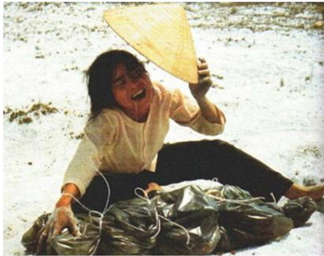
Nạn nhân Cộng Sản tại Huế, tết Mậu Thân 1968.