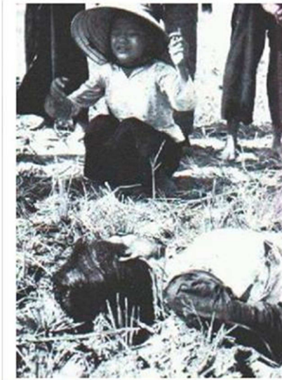
Nạn nhân Cộng Sản Tết Mậu Thân, 1968

và cán bộ, công chức VNCH bị kẹt tại Huế, cùng các giáo sư người Đức dạy tại Đại học Y Khoa, qua chỉ điểm của VC nằm vùng và sau này Lê Minh lẫn Bùi Tín đều xác nhận Việt Cộng đã tận tụy tàn sát vô nhân đạo đồng bào vô tội tại Huế vào Tết Mậu Thân 1968.