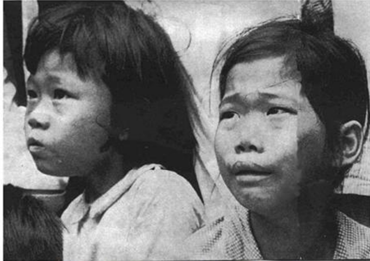
Nạn nhân Cộng Sản Tết Mậu Thân, 1968.

Nói chung cộng sản tàn sát đồng bào Huế nhiều nhất là tại khu dân cư Gia Hội vì vùng này bị VC chiếm lâu nhất từ ngày mùng 2 Tết đến 22-2-1968 mới được Biệt Động Quân giải tỏa, bởi vậy giặc và Việt gian mới có cơ hội giết nhiều đồng bào vô tội. Cho đến nay không ai biết chính xác số người bị VC tàn sát tại Huế là bao nhiêu nhưng căn cứ vào thống kê số hài cốt tìm được trong một số hầm chôn tập thể sau khi giặc bị đánh đuổi khỏi thành phố, tại các địa điểm Trường Gia Hội, Chùa Theravada, Bãi Dâu, Cồn Hến, Tiểu Chủng viện, Quận tử nạn, Phía đông Huế, Lăng Tự Đức, Đồng Khánh, Cầu An Ninh, Cửa Đông Ba, Trường An Ninh Hạ, Trường Vân Chí, Chợ Thông, Chùa Từ Quang, Lăng Gia Long, Đòng Di, Vịnh Thái, Phù Lương, Phú Xuân, Thượng Hòa, Thủy Thanh, Vĩnh Hưng và Khe Đá Mài... tổng cộng đếm được 2326 xác.