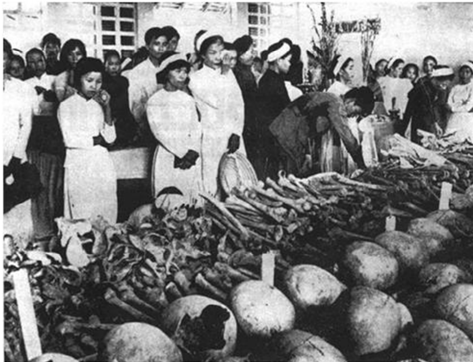
Di cốt nạn nhân của Cộng sản VN ở Huế trong cuộc Tổng công kích Tết Mậu Thân 1968.

Về câu hỏi tại sao VC tàn sát thường dân vô tội, đến nay Hà Nội vẫn tránh né, còn Võ nguyên Giáp thì đều giả hơn khi bị các ký giả ngoại quốc phỏng vấn sau Tết Mậu Thân, đã trả lời là Bắc Việt không hề biết vì đó là chuyện của MTGPMN và VNCH. Theo các nhà nghiên cứu trong và ngoài nước, thì động cơ cộng sản tàn sát dân chúng tại Huế, ngoài một lý do nhỏ là sự trả thù do hờn oán trước đây giữa cá nhân và cá nhân, thì tàn sát theo kế hoạch phá hủy và làm rối loạn bộ máy cầm quyền của VNCH, điều này đã được ghi lại trong một tài liệu của cán bộ VC, bị SĐ1 Không kỵ Hoa Kỳ bắt được tại tỉnh Thừa Thiên ngày 12-6-1968. Tàn sát để khủng bố và cảnh cáo đe dọa dân chúng đừng tòng quân chống cộng. Tàn sát tín đồ Thiên Chúa Giáo để chia rẽ sự đoàn kết tại miền nam, tạo sự nghi kỵ giữa các tôn giáo cho tới ngày VC cưỡng chiếm được miền Nam mới chấm dứt vì VC độc tài đảng trị, cấm biểu tình xuống đường, nên bốn bên bốn phía bình đẳng chịu sống chung hòa bình. Từ đó mới không thấy tự thiêu, tuyệt thực và ra báo chống đối, bêu xấu, hạ nhục chính quyền như cơm bữa thời VNCH. Tàn sát dân chúng để gây tiếng vang với thế giới.