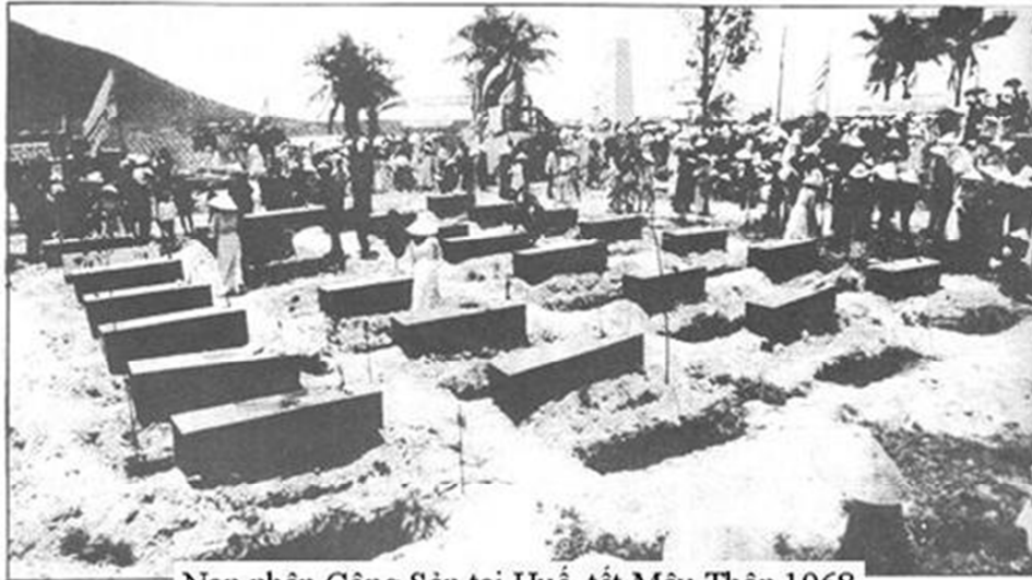
Nạn nhân Cộng Sản tại Huế, tết Mậu Thân 1968.