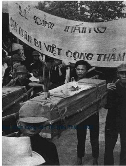
Nạn nhân Cộng Sản Tết Mậu Thân, 1968.

đau gãy sập. Hỡi ôi sắt thép, gỗ đá còn biết rơi nước mắt với Huế thê lương, trong khi đó lại có không ít người thản nhiên đứng vỗ tay cười.