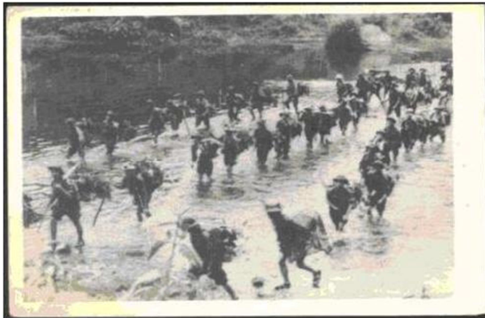
Bộ đội VC