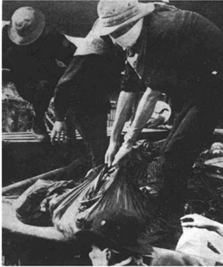
Nạn nhân Cộng Sản Tết Mậu Thân, 1968

Cũng nói thêm là VC đã lợi dụng những xáo trộn tại Huế trong các năm 1965, 1966, xâm nhập hoạt động cũng như móc nối dụ dỗ một số học sinh, sinh viên, quá mê thầy mà phản nước hại dân. Thật ra mặt trận quan trọng nhất của VC ở Huế là mặt trận chính trị, vì vậy Hà Nội bắt chập máu xương của cán binh và thường dân vô tội, ra lệnh cho đám tàn binh phải cố thủ trong Đại Nội dù thực trạng bi thảm tuyệt vọng bởi các vòng vây của quân lực Hoa Kỳ và VNCH.