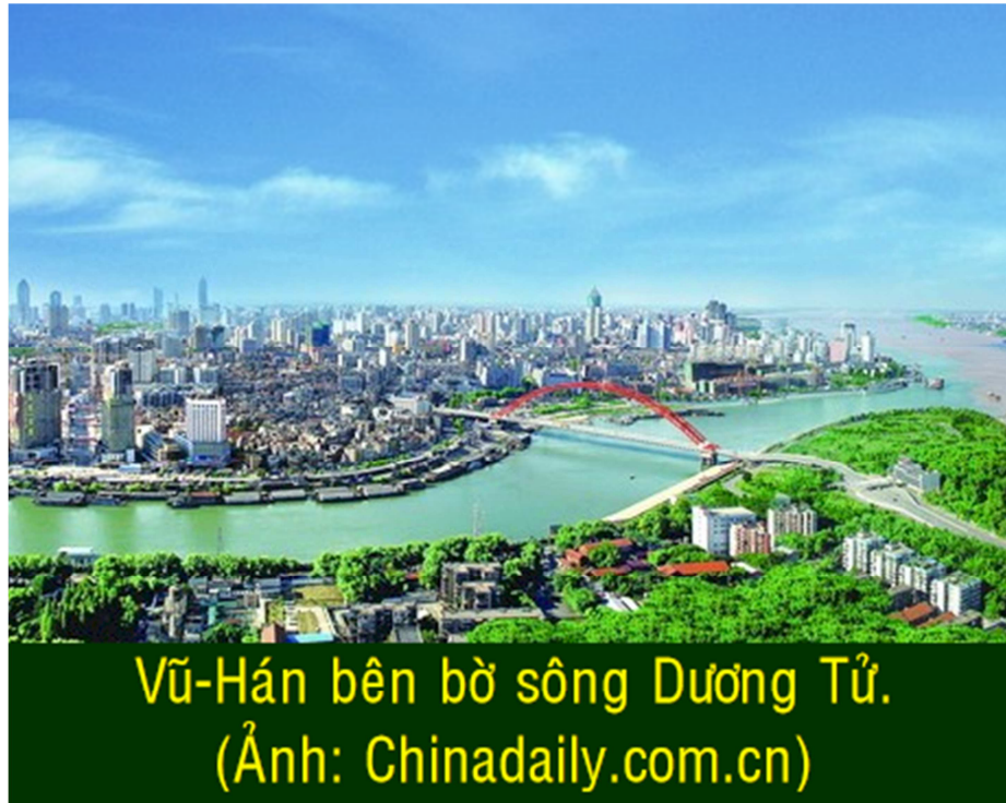
Vũ-Hán bên bờ sông Dương Tử.