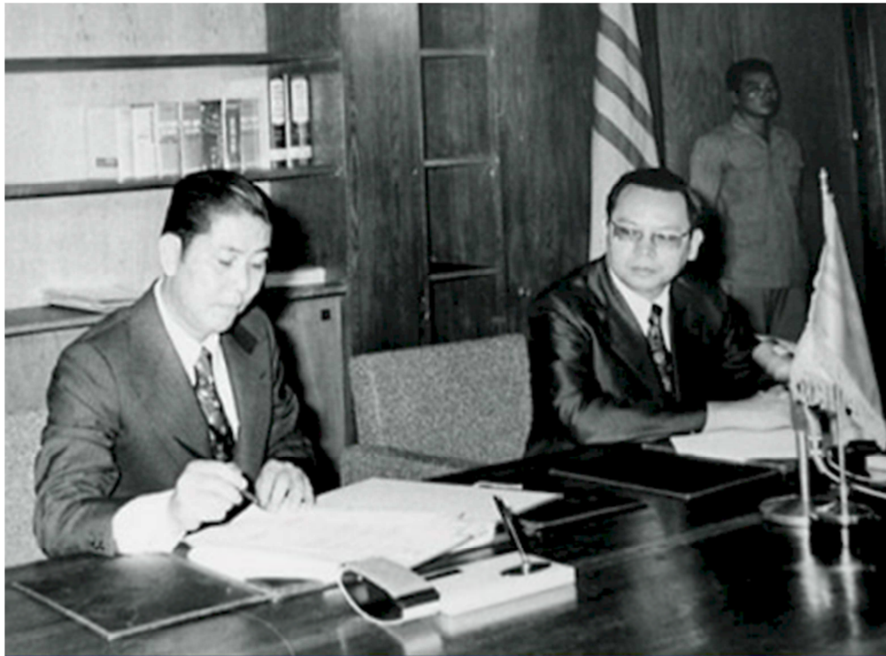
Tân Thủ Tướng Nguyễn Bá Cẩn ký nhận bàn giao chức vụ Thủ Tướng VNCH từ cựu Thủ Tướng là Đại tướng Trần Thiện Khiêm