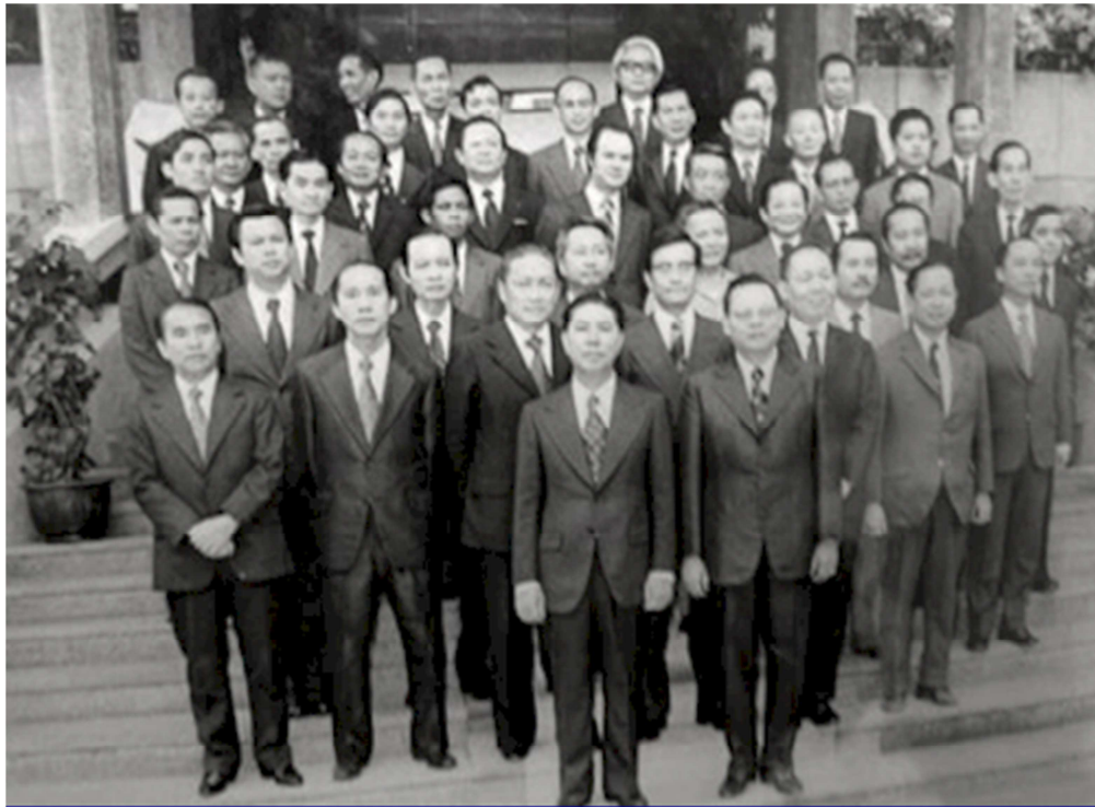
Vào ngày 14/4/1975, Tân Thủ Tướng Nguyễn Bá Cẩn trình diện thành phần nội các

Về Quân Lực VNCH, ngoài tập thể chiến sĩ cố thủ trên quên hương, tập thể Chiến Sĩ QLVNCH Hải Ngoại cũng đã được đoàn ngũ hóa. Tại mỗi tiểu bang, quốc gia đều có Hội Chiến Sĩ QLVNCH; các Tổng Hội Chiến Sĩ các quân, binh chủng; các Tổng Hội Cựu sinh viên Sĩ Quan, Hạ Sĩ Quan và Binh Sĩ của các quân trường Hải, Lục, Không quân mà quân số tổng cộng không dưới vài sư đoàn.