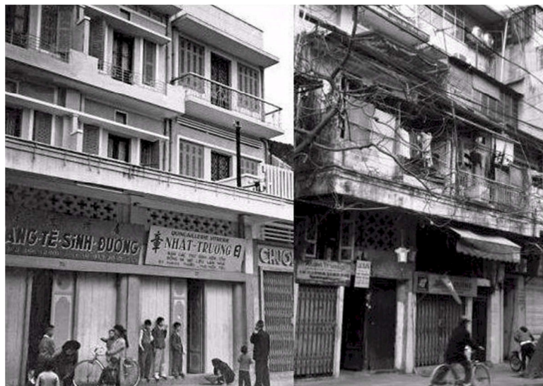
Hình nào chụp năm 1952? Hình nào chụp 59 năm sau?!

Hà Nội còn nổi danh với khu Khâm Thiên, nơi giải trí của các bậc thức giả phong lưu. Họ đã ngẫu hứng sáng tác ra những bài ca trù cho các ả đào ngâm nga bên khay rượu. Giọng ngâm thơ xen lẫn với tiếng trống chầu thường, phật, khen, chê đã nâng cao trình độ nghệ thuật của một thú ăn chơi nửa thanh nửa tục. Nhiều bài hát ả đào đã nổi danh, được lưu truyền trong văn học và làm phong phú thêm cho nền văn hóa Việt Nam.