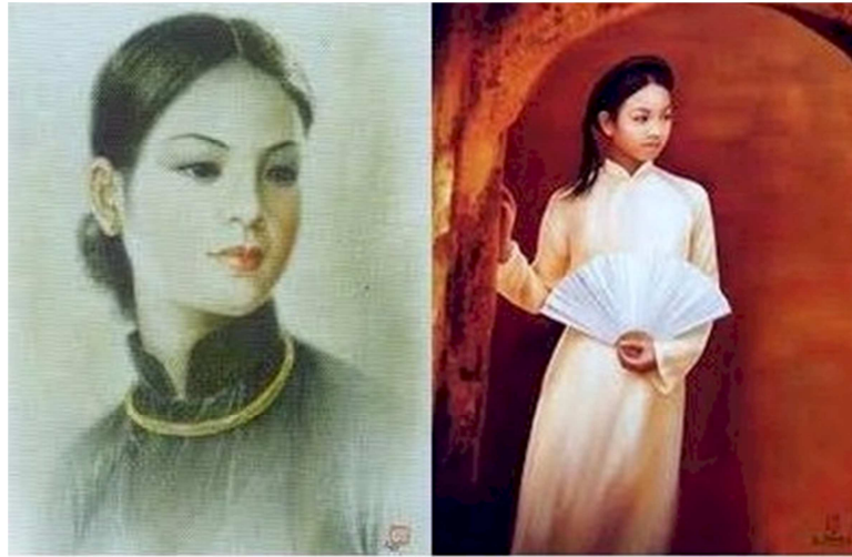
Ảnh minh họa: Con gái Hà Nội xưa.

Dậu, khi vừa chiến thắng trận Đống Đa, vua Quang Trung vào thành Thăng Long và đã tới ngay làng Nhật Tân để chọn một cành đào đẹp nhất gửi về tặng Bắc Cung Hoàng Hậu, là công chúa Ngọc Hân.