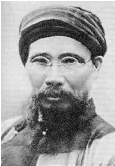
CỤ PHAN BỘI CHÂU