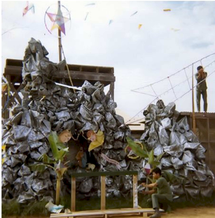
Các quân nhân Sư Đoàn 7 BB đang trang trí hàng đá trong đơn vị.