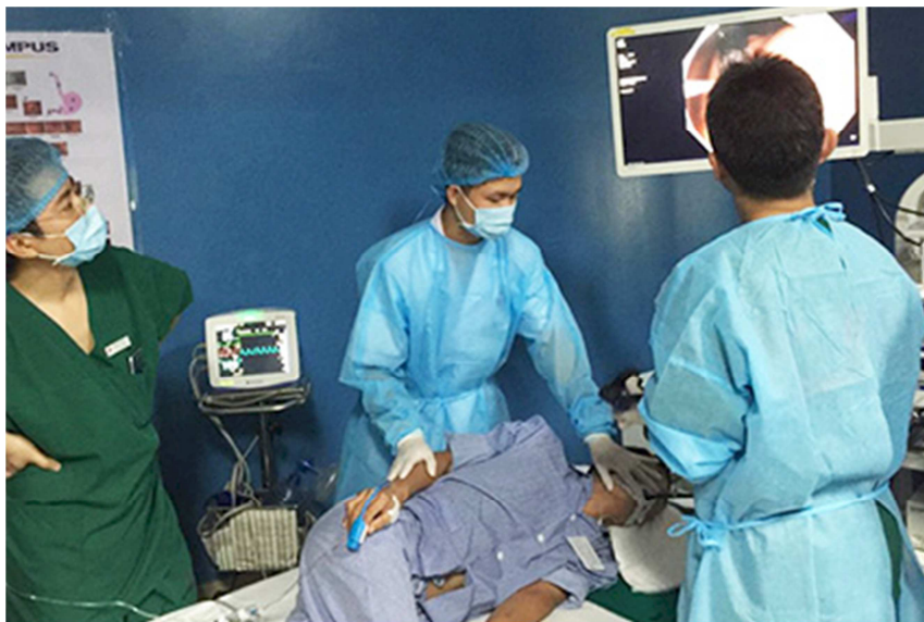
Bệnh nhân ung thư đang được điều trị tại Bệnh viện K.

Ung thư gan đang dẫn đầu loại bệnh ung thư thường gặp ở nam giới, kế tiếp là phổi, dạ dày, đại trực tràng. Ở nữ giới, ung thư thường gặp lần lượt là vú, dạ dày, phổi. Phần lớn bệnh ung thư đều có thể chữa khỏi nếu phát hiện sớm, điều trị kịp thời và đúng phương pháp. Tuy nhiên, [trên] thực tế, hầu hết người bệnh ung thư ở Việt Nam khám và điều trị ở giai đoạn muộn, tỷ lệ sống thấp.