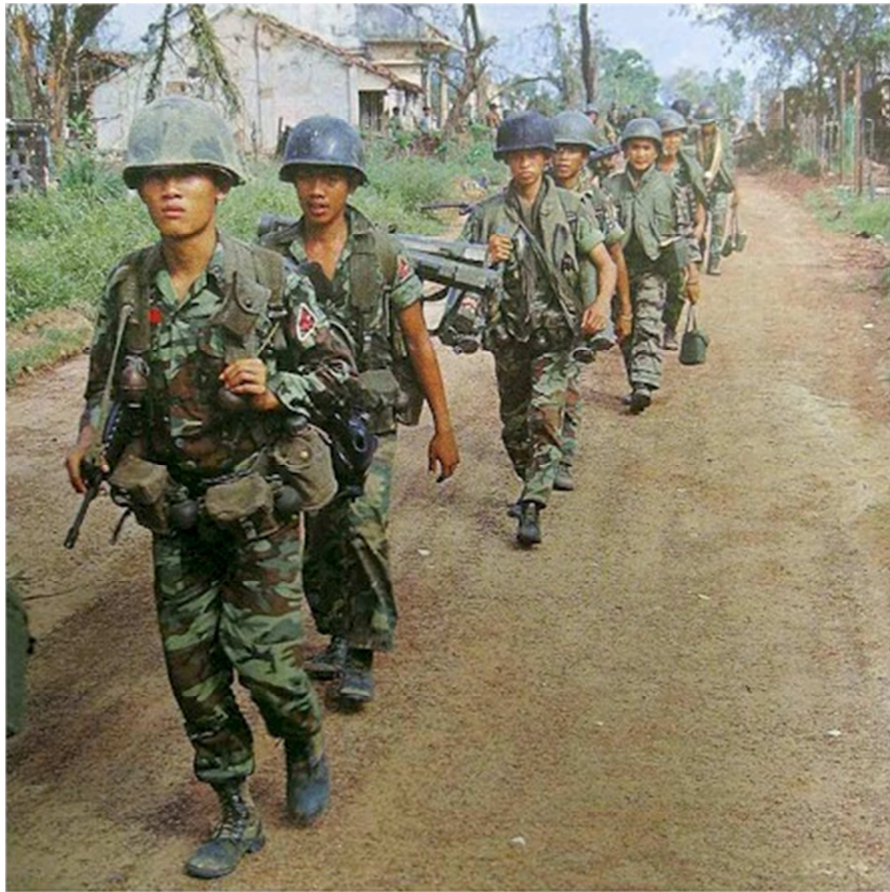
Soldiers of the Assault #4 Company of 81st Airborne Ranger Battalion on the move