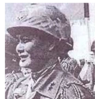
TRUNG TƯỚNG NGUYỄN VĨNH NGHI