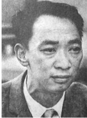
Di ảnh Cố Thiếu Tướng NGUYỄN NGỌC LOAN FEB-11-1930 * JUL-14-1998