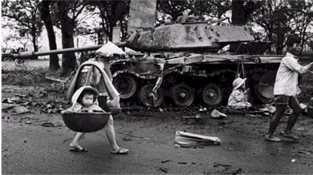
Trở về nhà sau trận chiến tại Huế

Khi quân Bắc Việt mở cuộc tấn công cuối cùng tiến tới thống nhất đất nước hồi 1975, hàng trăm ngàn dân thường ở miền Nam Việt Nam đã bỏ chạy. Dường như trong tâm trí nhiều người, câu chuyện về “những vụ thảm sát ở Huế” vẫn còn đậm dấu ấn.