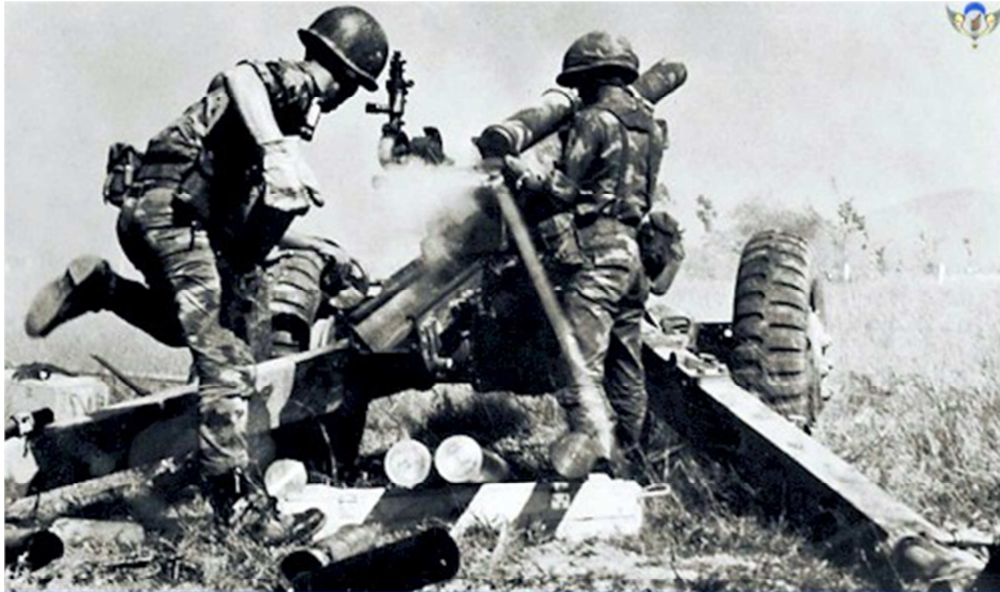
Pháo Binh Nhảy Dù yểm trợ chiến trường