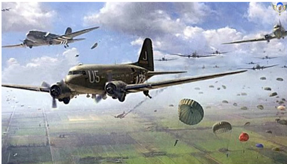
Ngày 20/11/1953, 63 chuyến bay C-47 Dakota thả 3,000 lính dù và chiến cụ xuống Điện Biên Phủ.