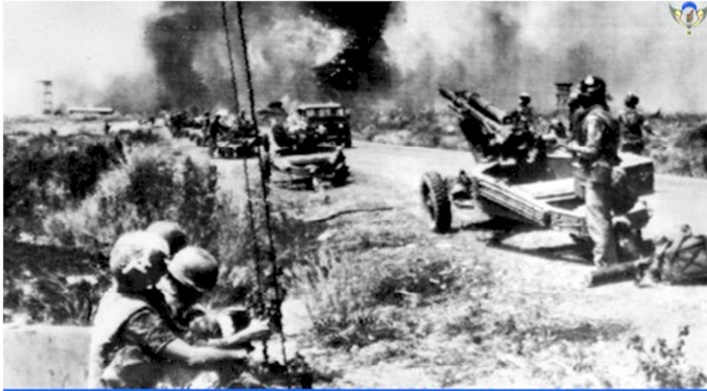
Pháo Binh Nhảy Dù tại mặt trận An Lộc 1972