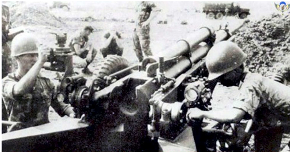
Pháo Binh Nhảy Dù tại mặt trận Hạ Lào 1971

-Tiểu Sử và Thành Tích của Sư Đoàn Nhảy Dù do BTL/SĐND/ Phòng TLC ấn hành năm 1974.