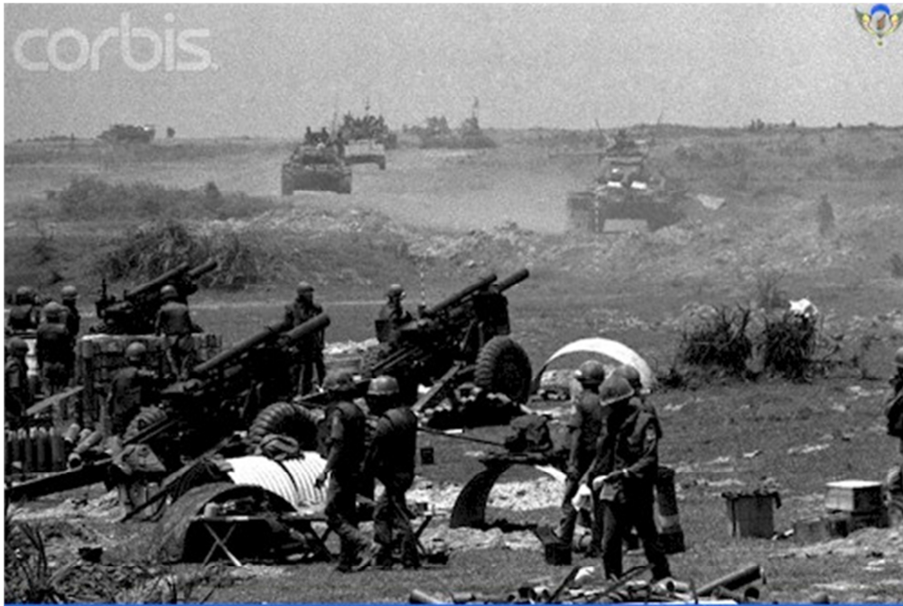
Pháo Binh Dù trong Chiến dịch Lôi Phong tháng 7/1972