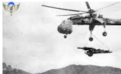
Hành Quân Không Vận