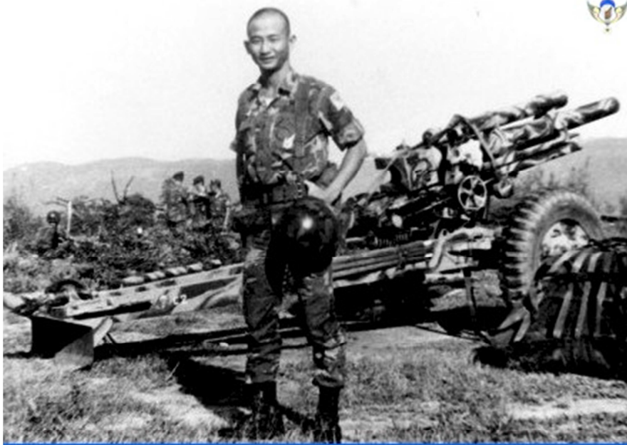
Đại Bác 105ly M102