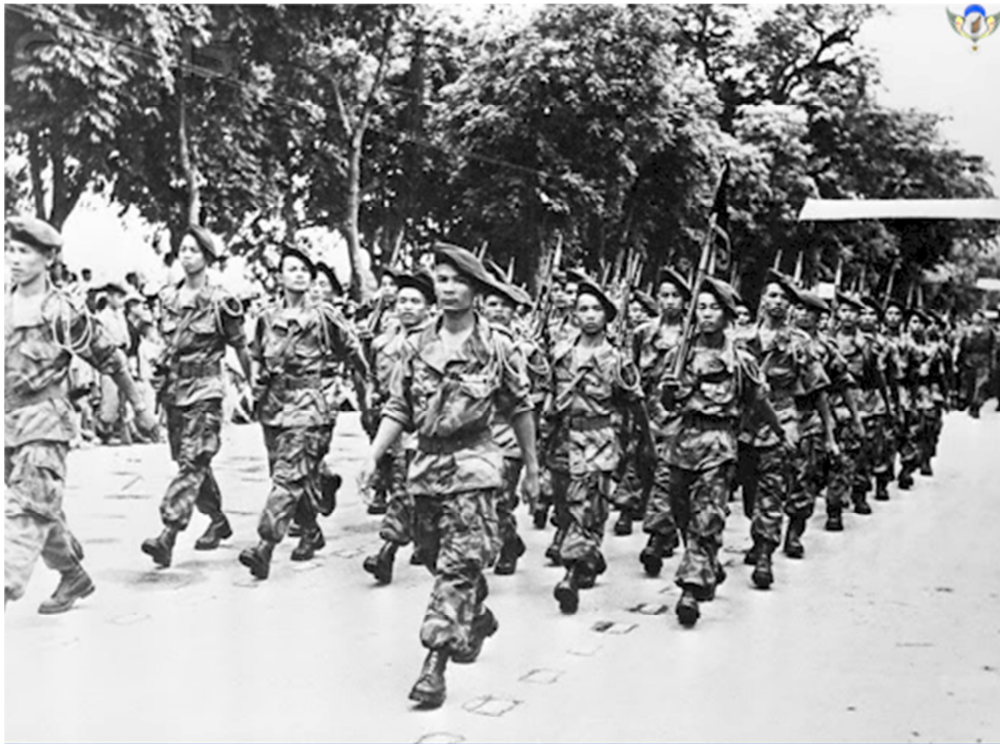
TĐ5ND diễn hành ngày 12/6/1954 tại Hà Nội