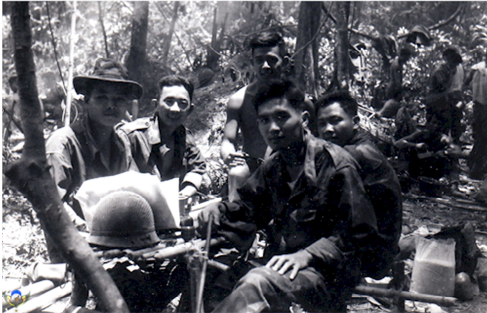
Tiểu Đoàn 5 Nhảy Dù hành quân tại Chiến Khu D năm 1956