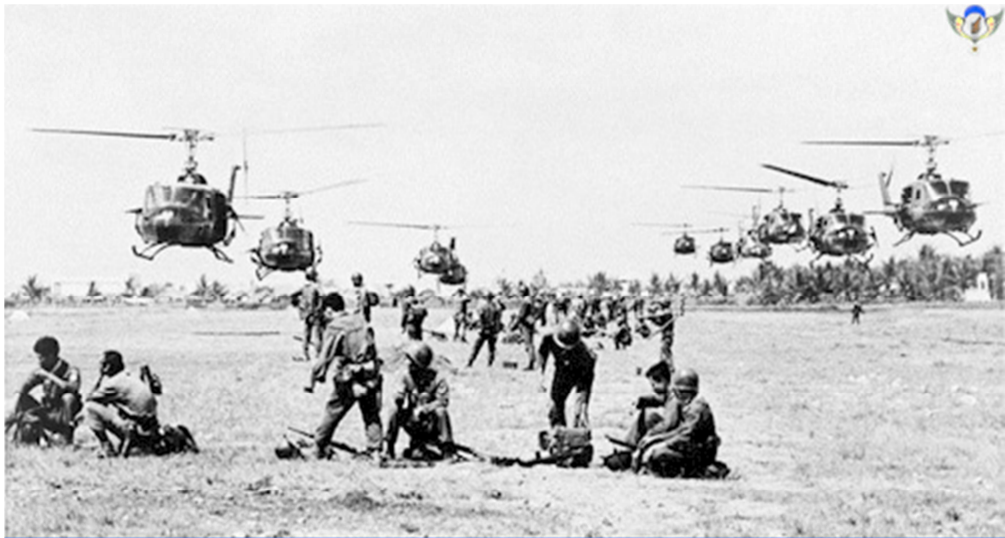
Hàng đoàn Trực Thăng UH-1Ds tham gia chiến dịch trực thăng vận