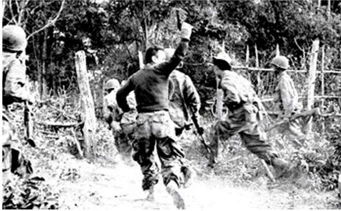
Lính Nhảy Dù xung phong