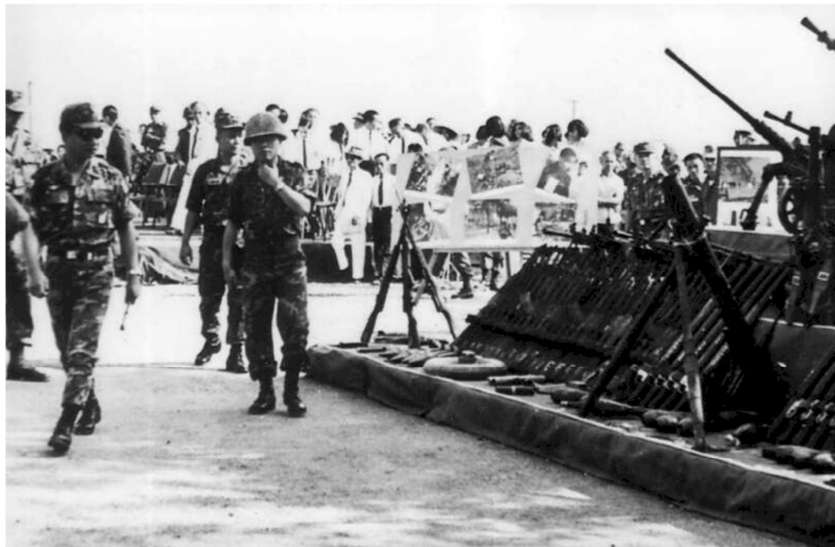
Triển lãm chiến lợi phẩm