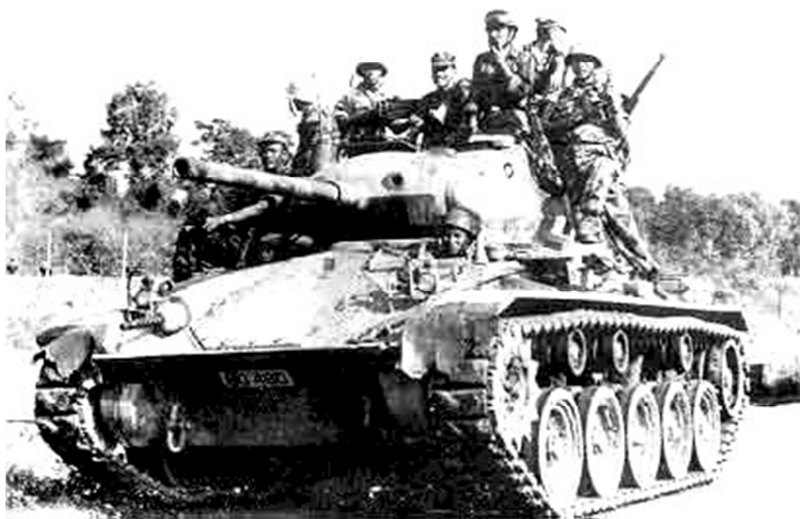
Lực lượng TQLC từng thiết di chuyển trên QL-19 trong cuộc hành quân Dân Thắng 7.

Kết Quả: Trong cuộc đụng độ giữa quân Nhảy Dù và CSBV