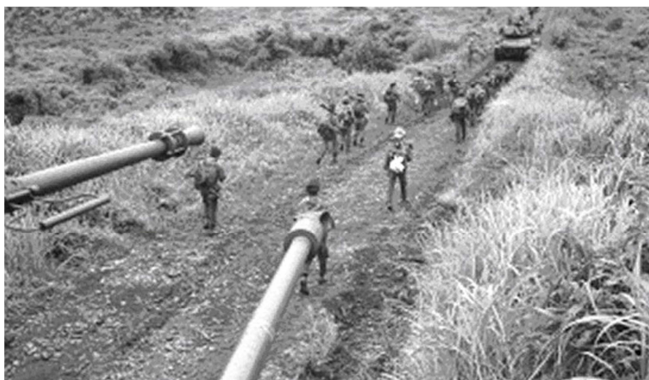
Hình chụp một đơn vị bộ chiến VNCH đang di chuyển trên Quốc lộ 19 trong cuộc hành quân giải tỏa Đức Cơ năm 1965