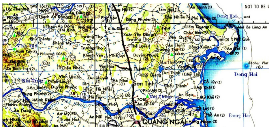
Khu vực hành quân Liên Kết 81

Trong khi đó Trung Đoàn 4BB đã yểm trợ cho dân chúng tập nập vào gặt lúa đưa về nơi an toàn trong mấy ngày liên tiếp. Đến ngày 22/2/1967 Hành quân LK81 kết thúc: 813 VC bị hạ, 52 bị bắt sống, tịch thu 43 súng cộng đồng, 539 súng cá nhân.