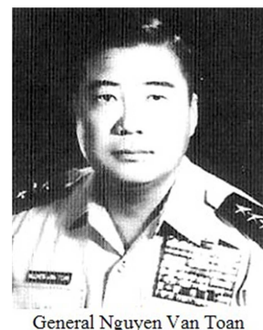
General Nguyễn Văn Toàn

Nhờ vậy, kế hoạch bình định trong năm này được thành công tốt đẹp, dân chúng dần dần được an ổn làm ăn, khiến các đơn vị chủ lực tỉnh, địa phương huyện và du kích cộng sản bị loại dần, hoạt động không còn hữu hiệu và mất dần địa bàn hoạt động. CSBV phải tăng cường nhịp độ xâm nhập người và vũ khí vào miền Nam bằng đường bộ qua đường mòn HCM và bằng đường biển. Lực lượng chính quy của địch bắt buộc phải lộ diện, nhưng mỗi lần chúng tập trung quân, lại bị SĐ2BB càn quét nhờ vào lưu động tính và sức mạnh của Sư Đoàn 2 Bộ Binh được tập trung.