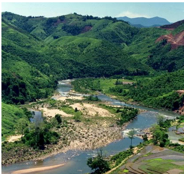
Sông núi tại Quảng Ngãi

Vùng hành quân bao gồm khu vực giữa hai con sông Trà Bồng và Trà Khúc. Khu vực này là hành lang xâm nhập quan trọng của CS từ bờ biển nối với mật khu Đổ Xá, nơi đóng quân của BTL/QK5CS.