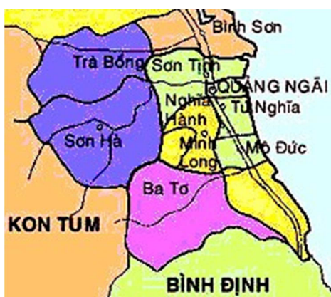
Bản đồ tỉnh Quảng Ngãi

Năm Tân Mão 1471, Vua Chiêm là Trà Toàn sang phá quấy vùng biên giới, vua Lê Thánh Tông đem 20 vạn quân thủy bộ ngự giá thân chinh, quân Chiêm phải rút lui về cố thủ tại Trà Bàn. Vua Lê ra lệnh tiến quân vào cửa Thị Nại, ngày 26 tháng 2 Âm Lịch vây đánh Trà Bàn và bắt được vua Chiêm. Từ đó Chiêm Thành thần phục nước ta. Vua Lê Thánh Tông lấy đất Đồ Bàn và Cổ Lũy lập ra Đạo Quảng Nam. Quảng Ngãi là một trong ba phủ thuộc Đạo Quảng Nam và thay đổi tên nhiều lần qua các triều đại như Phủ Quảng Nghĩa (1558) Đời nhà Nguyễn Tây Sơn (1788-1802) cải Quảng Nghĩa thành Hóa Nghĩa phủ (1788). Năm 1802, Gia Long đặt Quảng Nghĩa dinh rồi đổi Quảng Nghĩa trấn vào năm 1808. Đời Minh Mạng đặt là tỉnh Quảng Nghĩa vào năm 1834.