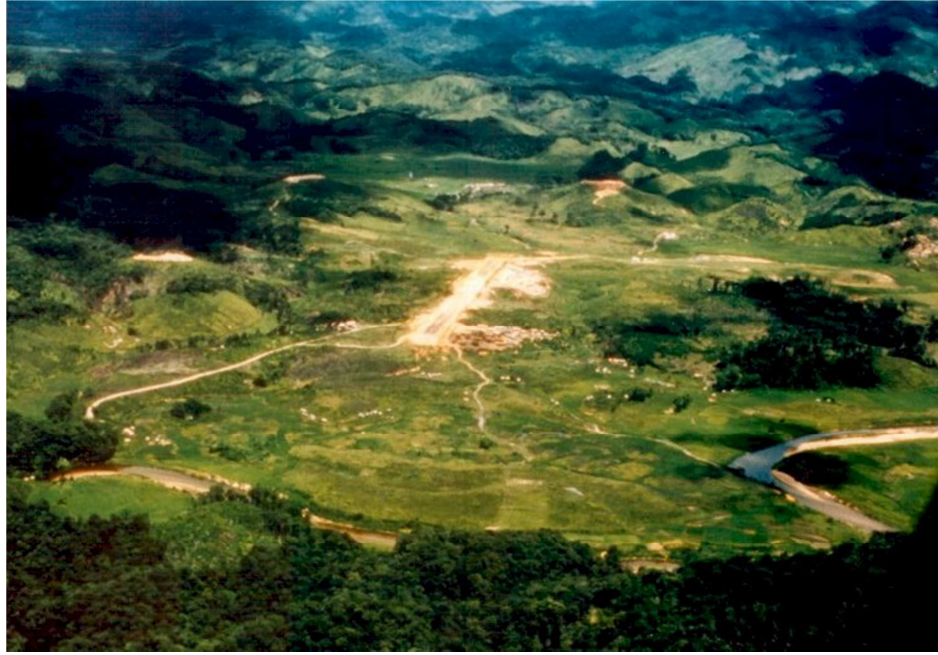
Thung lũng và Căn Cứ A-Shau (cạnh phi đạo)