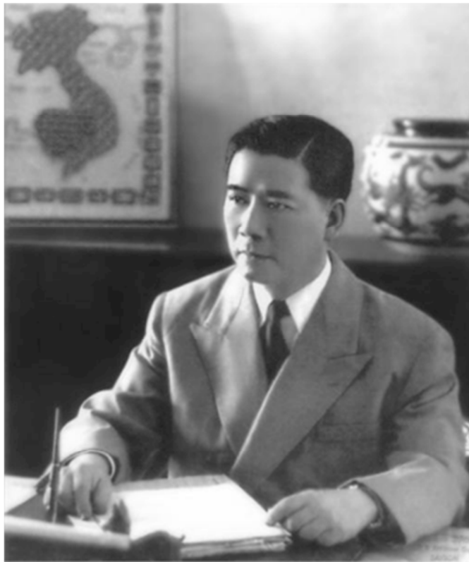
Tổng Thống Ngô Đình Diệm: Người đã khai sáng Nền Cộng Hòa Việt Nam