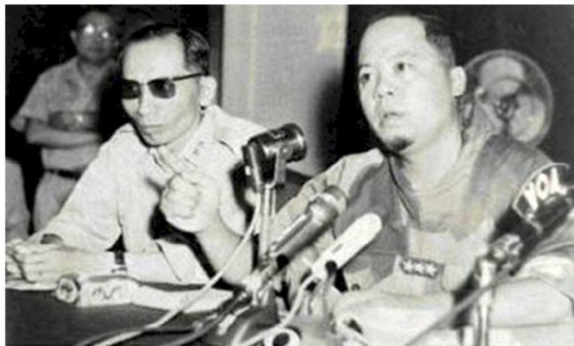
Đỗ Mậu, kính đen, ngồi với Nguyễn Khánh sau khi làm Chính Lý, hạ Dương Văn Minh, bắt 5 Tướng đảo chính đưa lên giữ ở Đà Lạt.