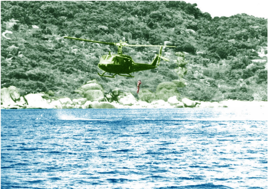
Nhảy Trực Thăng không dù.

Hôm nay là ngày đầu tiên thực tập nhảy không có dù từ trực thăng xuống biển từ ngoài khơi bơi vào bờ để phá hoại.