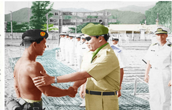
Đại Tướng Nguyễn Khánh, Tổng Tư Lệnh Quân Lực Việt Nam Cộng Hòa.