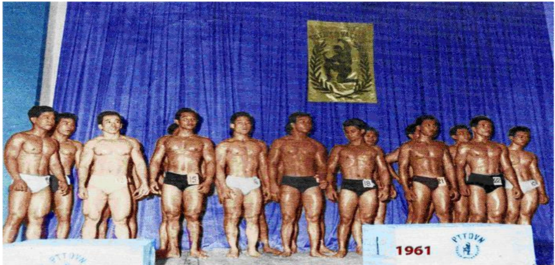
Buổi Thi Lực sĩ Đẹp (Thẩm Mỹ) 1961 tại Ty Thanh Niên Đô Thành. Góc đường Hai Bà Trưng và Hồng Thập Tự, Sài Gòn. Là lần cuối cùng. Vì sau đó Bà Cố vẫn Ngô Đình Nhu đã cấm vì cho là “Công xúc tu sĩ”.