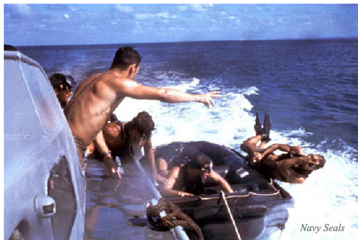
Phương pháp thả vớt của NN...

Bắt đầu các cuộc biểu diễn các môn như: Cận chiến, đột kích, phục kích, đổ quân từ ngoài khơi lội vào bờ phá các chướng ngại vật, phá hủy các công sự phòng thủ. Rồi bơi ra khơi so hàng dưới nước rồi tàu chạy đến kéo vớt lên với kỹ thuật đặc biệt của NN.