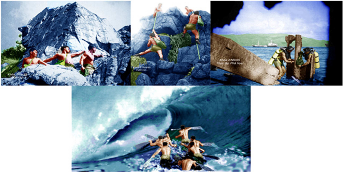
Thực tập Đột Kích. Ngày và đêm