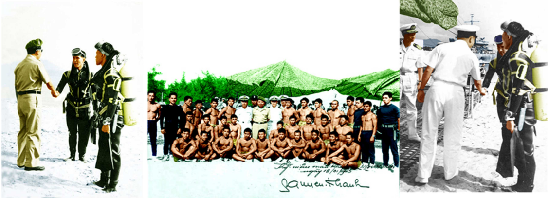
Ảnh từ trái qua: Đại Tướng Nguyễn Khánh, Tổng Tư Lệnh QL/VNCH.