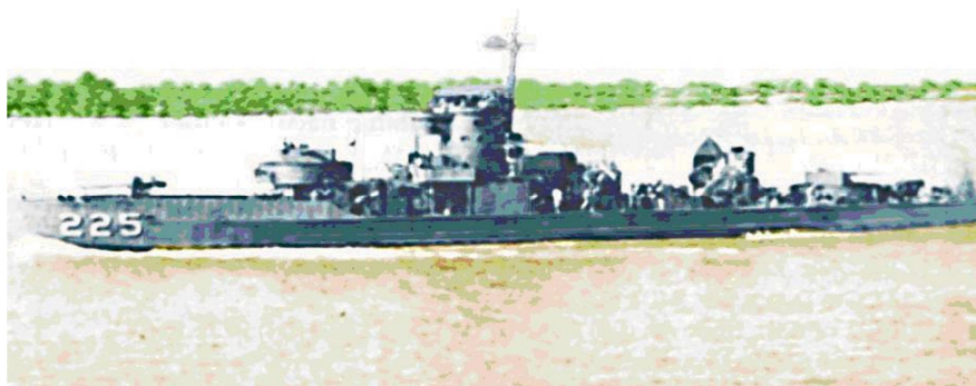
Thực tập hải nghiệp trên chiến hạm HQ 225 “Nữ Thần”

Tôi ghi tên tình nguyện đầu quân nơi phòng Tuyển Mộ tại đường Thi Sách ngày 4-10-1961 khóa 26 Thủy Thủ Chuyên Nghiệp. BTL/HQ/Phòng Quân Huấn (PQH) gửi khóa sinh Tân Binh lên TTHL/Quang Trung để học căn bản quân sự. Sau khi mãn khóa căn bản quân sự, BTL/HQ/PQH gửi chúng tôi xuống các chiến hạm để thực tập về hải nghiệp.