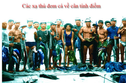
Các xạ thủ đem cá về cân tính điểm