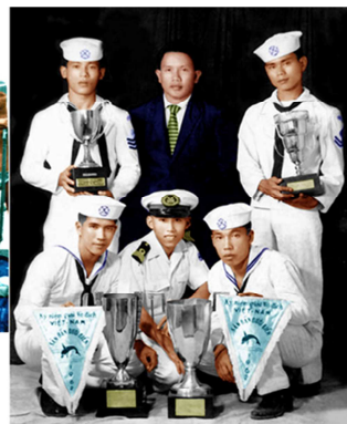
Đội Hải Quân Vô Địch Săn Bắn Cá dưới Biển VN. 1962