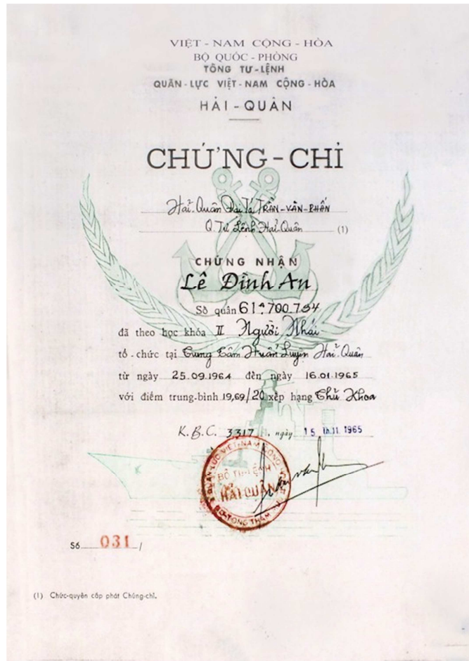
Chứng chỉ của HQNN, QLVNCH