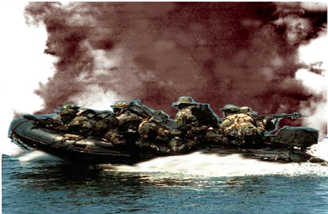
Người Nhái lập đầu cầu đổ quân tại Vũng Rô.

Ghi Chú: Bài viết này chỉ lược thuật riêng về nhiệm vụ của Người Nhái HQ/VNCH trong cuộc hành quân vĩ đại này gồm nhiều quân, binh chủng phối hợp.