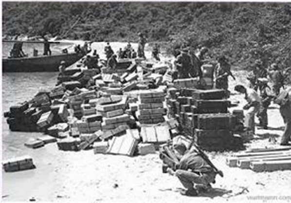
Weapon cache unloaded from VC sanken ship