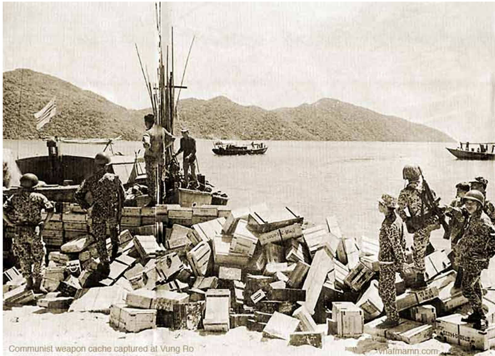
Communist weapon cache captured at Vung Ro