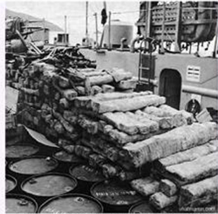
8,500 rifles and submachineguns were among the thousands of weapons of advanced design captured at Vung Ro