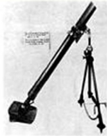
North Vietnamese 82 mm mortar captured in Kien Son in Oct. 1960.