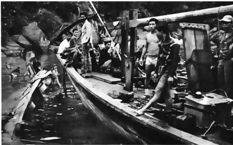
Hình ảnh nguồn: Vietnam War Untold Stories. ... Vung Ro

Part of the hull (left) of a North Vietnamese cargo ship which delivered a huge supply of arms and ammunition to the Viet Cong. It was sunk along the coast of Phu Yen Province by South Vietnamese aircraft. More than 100 tons of military supplies were seized.