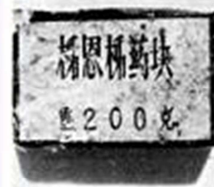
A 200 gram block of Chinese Communist TNT captured at Quang Tuy in Apr. 1962.