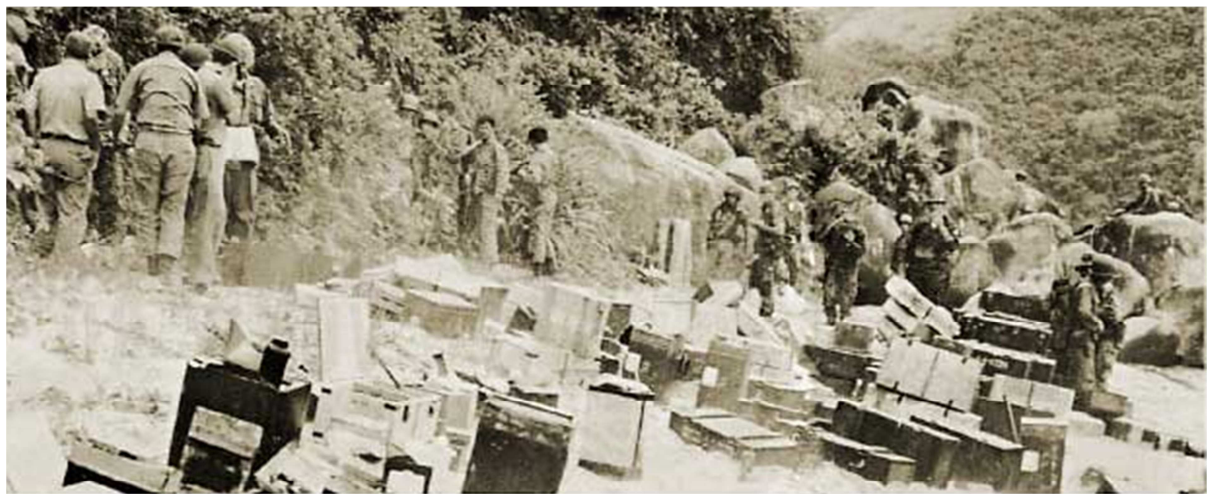
100 tons of war cargo for Viet Cong were brought by steel craft sunk at Vung Ro

Ảnh tài liệu UNTOLD STORIES Vietnam War.