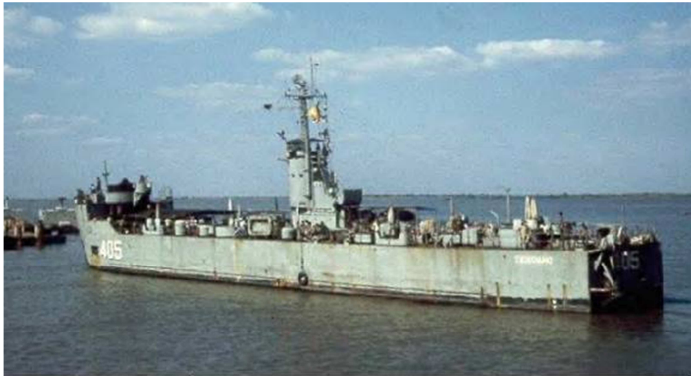
HQ405 TIEN GIANG - Hải Vân Ham LSM (Landing Ship Medium)

Một đại đội Biệt Kích Dù đổ bộ tràn lên bờ tiến sâu vào sườn núi tiến chiếm các mục tiêu trải rộng hai bên dải núi của vịnh.