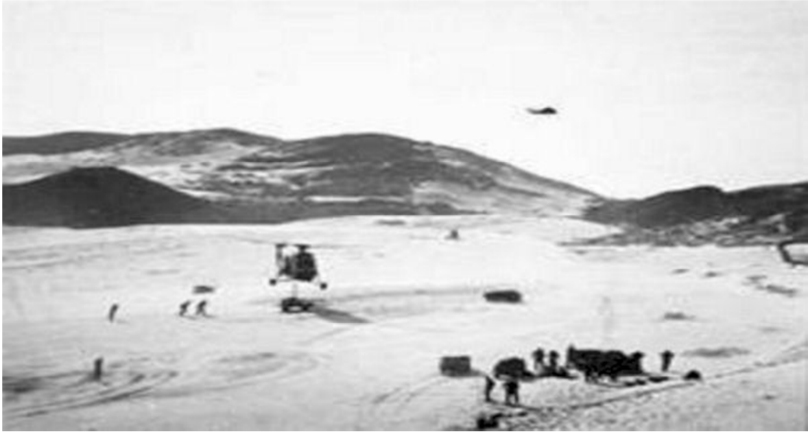
Trực Thăng Vận đồ bộ Đầm Môn Thượng

Tôi theo chân một đại đội TQLC xâm nhập vào làng. Chúng tôi thấy nhà cửa đều vắng lặng không một bóng người. Trong lúc đang lục soát các nhà bỗng nghe tiếng la vang của toán TQLC Mỹ. Tôi nhìn thấy toán lính Mỹ đang chĩa súng toan bắn và ném lựu đạn vào một miệng hầm che kín dưới rặng tre. Tôi vội chạy đến giơ tay khoát cản lại hành động của toán lính Mỹ và ra dấu để tôi làm việc này, tôi đến bên miệng hầm với khẩu súng lục P38 thủ trong tay, tôi hô to: "Bà con ở trong đó hãy ra khỏi hầm mau lên, nếu không ra thì sẽ bị ném lựu đạn vào hầm thì chết hết." Tôi chờ đợi và lập lại hai ba lần lời kêu gọi, thì thấy có người đàn bà đang bồng đứa con nhỏ trong tay bò ra và các người khác tiếp tục bò ra theo cho đến hết. Tôi nhảy xuống hầm bò vào trong để kiểm soát. Toán lính Mỹ đã hiểu ý tôi nên mỗi khi lục soát có hầm hố lính Mỹ đều gọi tôi đến tôi làm như căn hầm lần đầu cho đến hết khu vực trách nhiệm của Đại Đội có nhiều căn hầm được phát giác. Tôi tập trung khoảng một trăm người dân làng vừa từ dưới các hầm lên tất cả đều là đàn bà con nít và các cụ già. Tôi hỏi dân làng thanh niên trai tráng ở đâu? Dân làng cho biết là vì sợ bị bắt cho nên thanh niên thiếu nữ đều chạy lên núi lánh nạn. Sau khi khám xét xong, cho dân làng ngồi tập trung lại một chỗ để chờ lục soát hết nhà cửa.