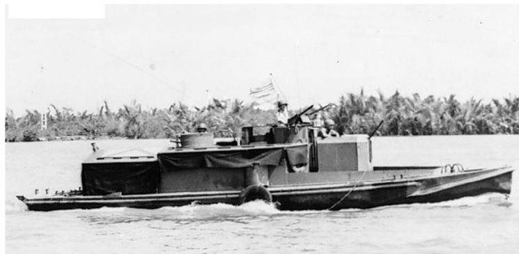
TIỂU GIÁP ĐÌNH ( Fom )

Khi đoàn giang đĩnh khởi hành, tôi và NN Nguyễn chia nhau xuống hai chiếc Tiểu Giáp Đĩnh (Fom) cùng vào nhiệm sở tác chiến với nhân viên cơ hữu HQ đi đầu mở đường cho đoàn giang đĩnh tiến vào vùng hành quân.