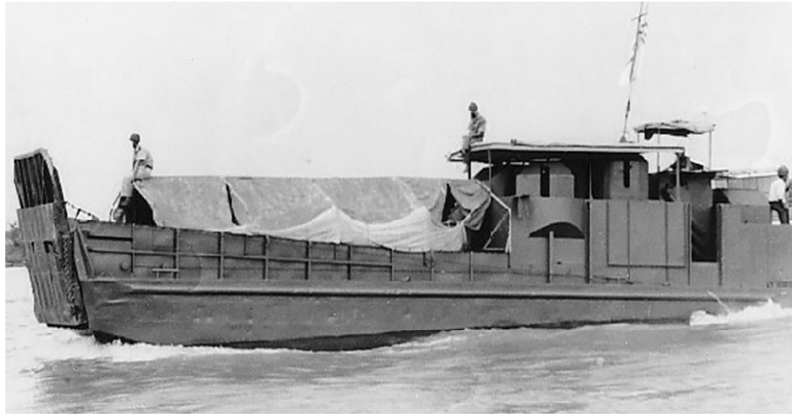
QUÂN VẬN ĐỈNH-6 - LCM-6 (Landing Craft Mechanized-6)

Nguyên nhân vì quân đội Việt, Mỹ đang bao vây chặt chẽ hai mặt trên bộ và càn quét trong vùng mật khu an toàn của chúng, buộc bọn Việt Cộng phải đào thoát về hướng thứ ba của hình tam giác là hướng dòng sông mà Việt Cộng hy vọng là sinh lộ. Để tránh bị phát giác trong việc đào thoát, chúng chờ đến ban đêm mới rút ra bờ sông, nhưng chúng không ngờ lại bị lọt vào vòng phục kích của bộ binh Tùng Thiết Mỹ bên bờ sông đối diện. Với vũ khí tối tân và hồng ngoại tuyến nhìn thấy rõ ban đêm, nên bọn VC không làm sao thoát được dưới hỏa lực kinh hồn của thiết Giáp kỵ Binh Hoa Kỳ.