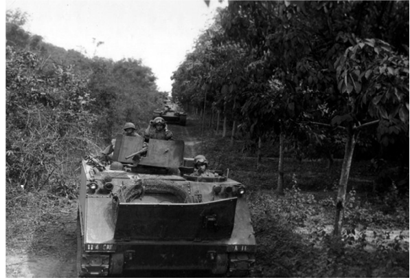
Thiết giáp của đại đội 3, Lực lượng Kỹ binh Cơ giới 11 Hoa Kỳ tham gia chiến dịch