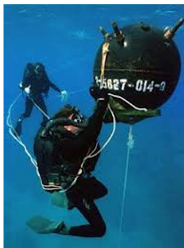
Người Nhái đang đặt chất nổ phá Thủy Lô.