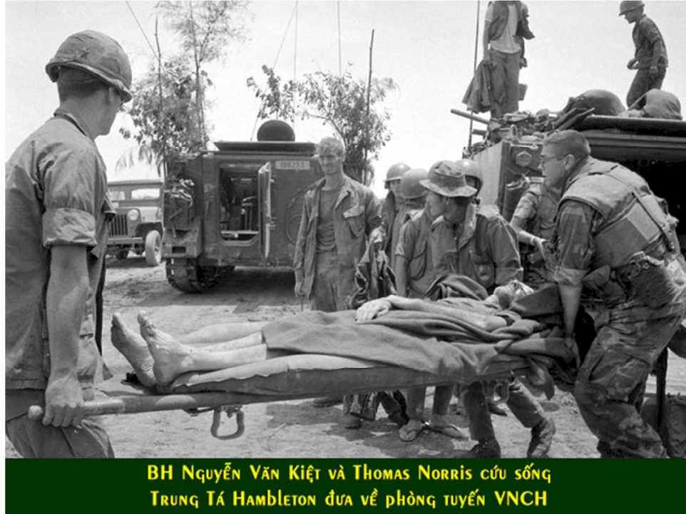
BH NGUYỄN VĂN KIẾT VÀ THOMAS NORRIS CỨU SỐNG TRUNG TÁ HAMBLETON ĐƯA VỀ PHÒNG TUYẾN VNCH