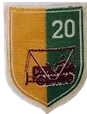
Huy hiệu Liên Đoàn 20 CBCĐ

Tiểu Đoàn 1 Công Binh Chiến Đấu (Sư Đoàn 1 Bộ Binh) Tiểu Đoàn 2 Công Binh Chiến Đấu (Sư Đoàn 2 Bộ Binh) Tiểu Đoàn 3 Công Binh Chiến Đấu (Sư Đoàn 3 Bộ Binh).