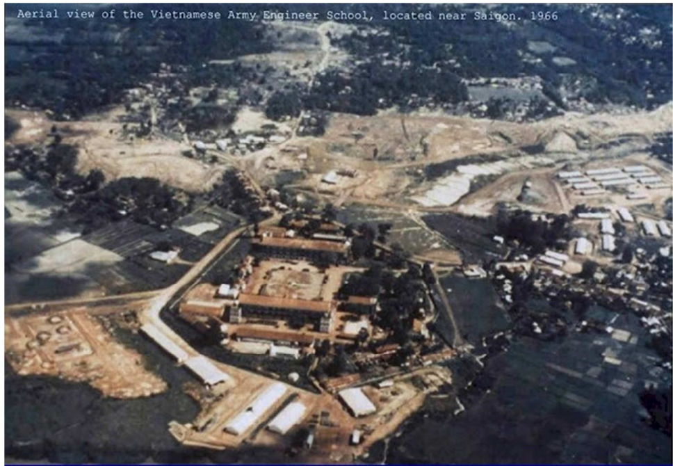
KHÔNG ẢNH TRƯỜNG CÔNG BÌNH NĂM 1966