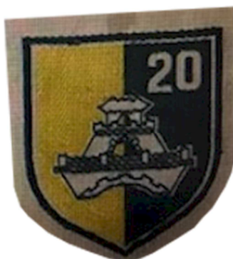
Huy hiệu Khu Tạo Tác 20 – Nha Trang