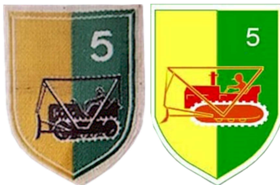
Huy hiệu Tiểu Đoàn 5 Công Binh Chiến đấu [TĐ5CBCĐ] Biệt phái cho Sư Đoàn 5 Bộ Binh QLVNCH

Tiểu Đoàn 23 Công Binh Chiến Đấu (Sư Đoàn 23 Bộ Binh).