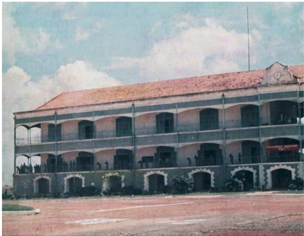
TÒA NHÀ BỘ CHỈ HUY TRƯỜNG CÔNG BÌNH QLVNCH