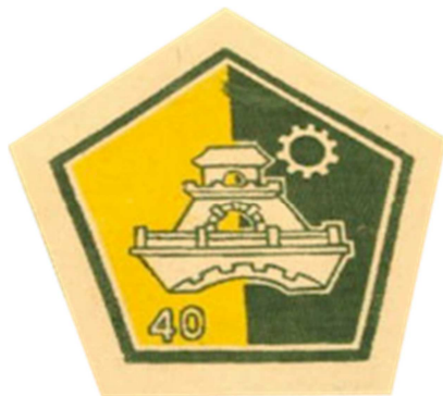
Huy hiệu Căn Cứ 40 Yểm Trợ Công Binh Gò Vấp

Tiểu Đoàn 25 Công Binh Chiến Đấu (Sư Đoàn 25 Bộ Binh).