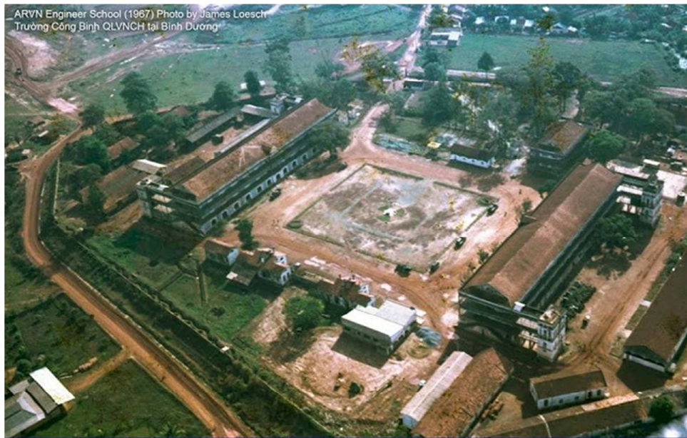
ARVN Engineer School (1967) Trường Công Binh QLVNCH tại Bình Dương