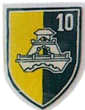
Huy hiệu Khu Tạo Tác 10 – Huế