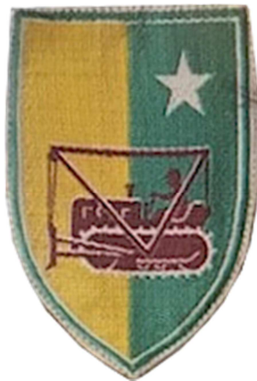
Huy hiệu Cục Công Binh Chiến Đấu [CBCD]

Ngày 1/8/1955 Binh chủng Công Binh chính thức được thành lập, đến tháng 11 năm 1955, Nha Vật Liệu Công Binh Trung Ương đổi thành Bộ Chỉ Huy Công Binh/Quân Đội Việt Nam Cộng Hòa, các Sở Vật Liệu Công Binh ở các Quân Khu, nay cũng được đặt vào cùng hệ thống chỉ huy chung của Bộ Chỉ Huy Công Binh, riêng ngành công thợ tạo tác vẫn hoạt động dưới sự điều động của các Quân Khu. Tháng 12 năm 1955, Trường Công Binh cũng được thiết lập tại Phú Cường tỉnh Bình Dương.