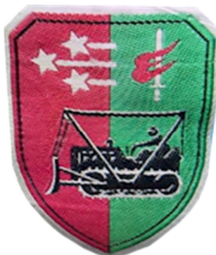
Huy hiệu Trường Công Binh QLVNCH