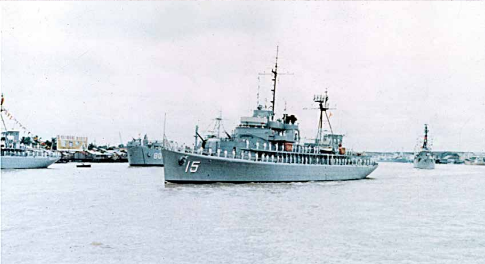
Tuần-dương-hạm Phạm-ngũ-Lão HQ 15