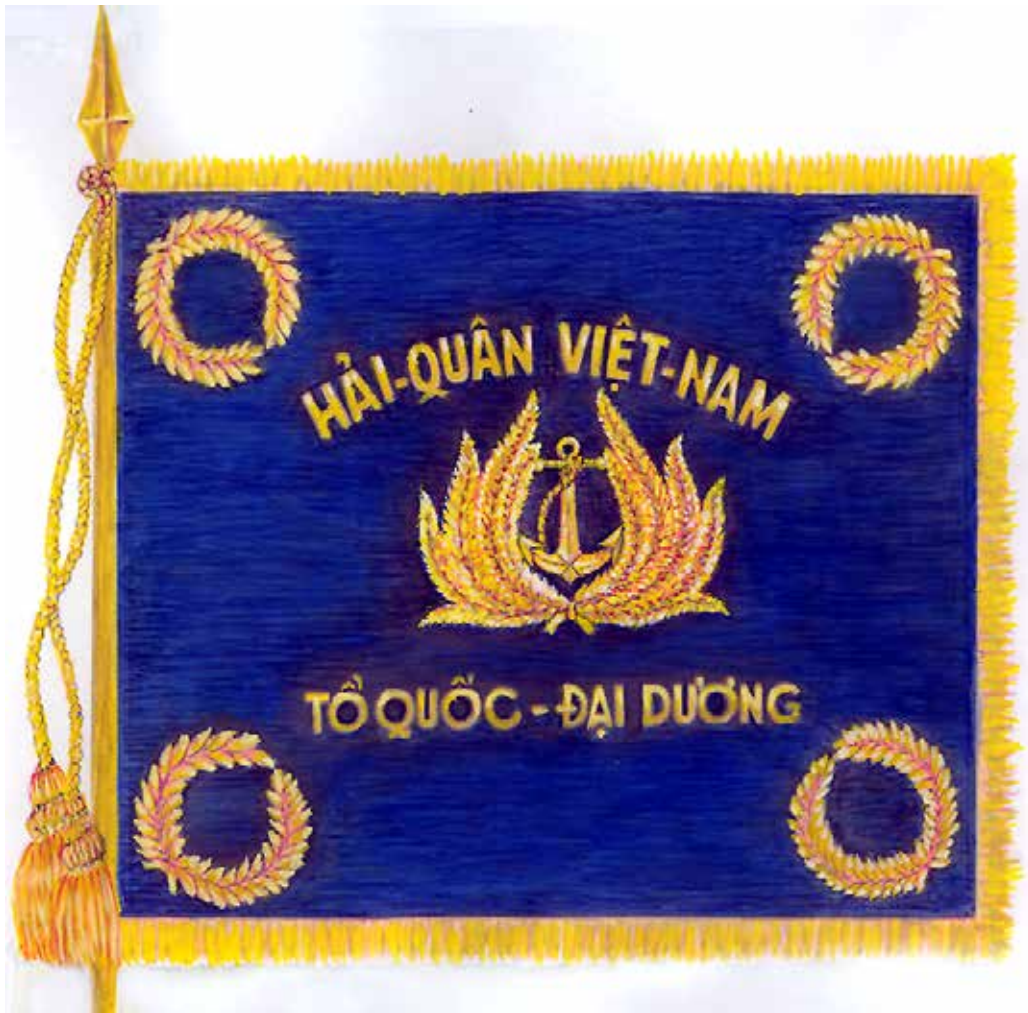
QUÂN-KỶ HẢI-QUÂN VIỆT-NAM