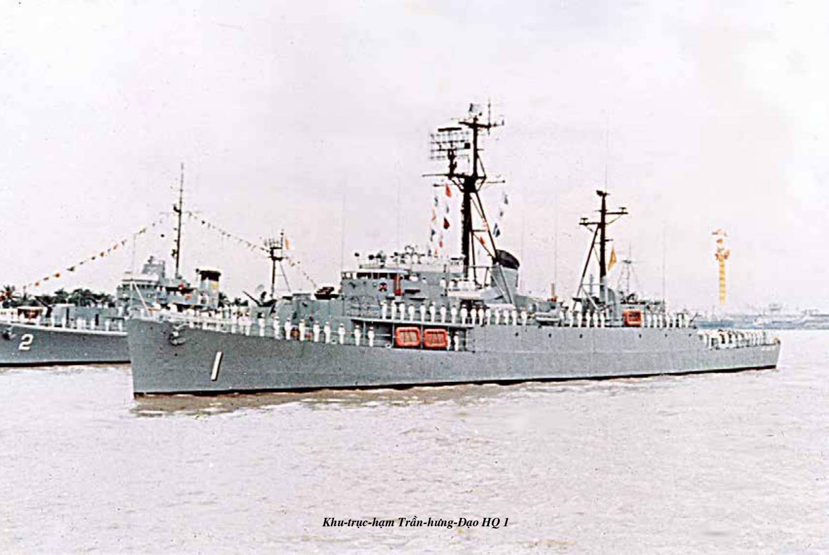
Khu-trục-hạm Trần-hưng-Đạo HQ 1