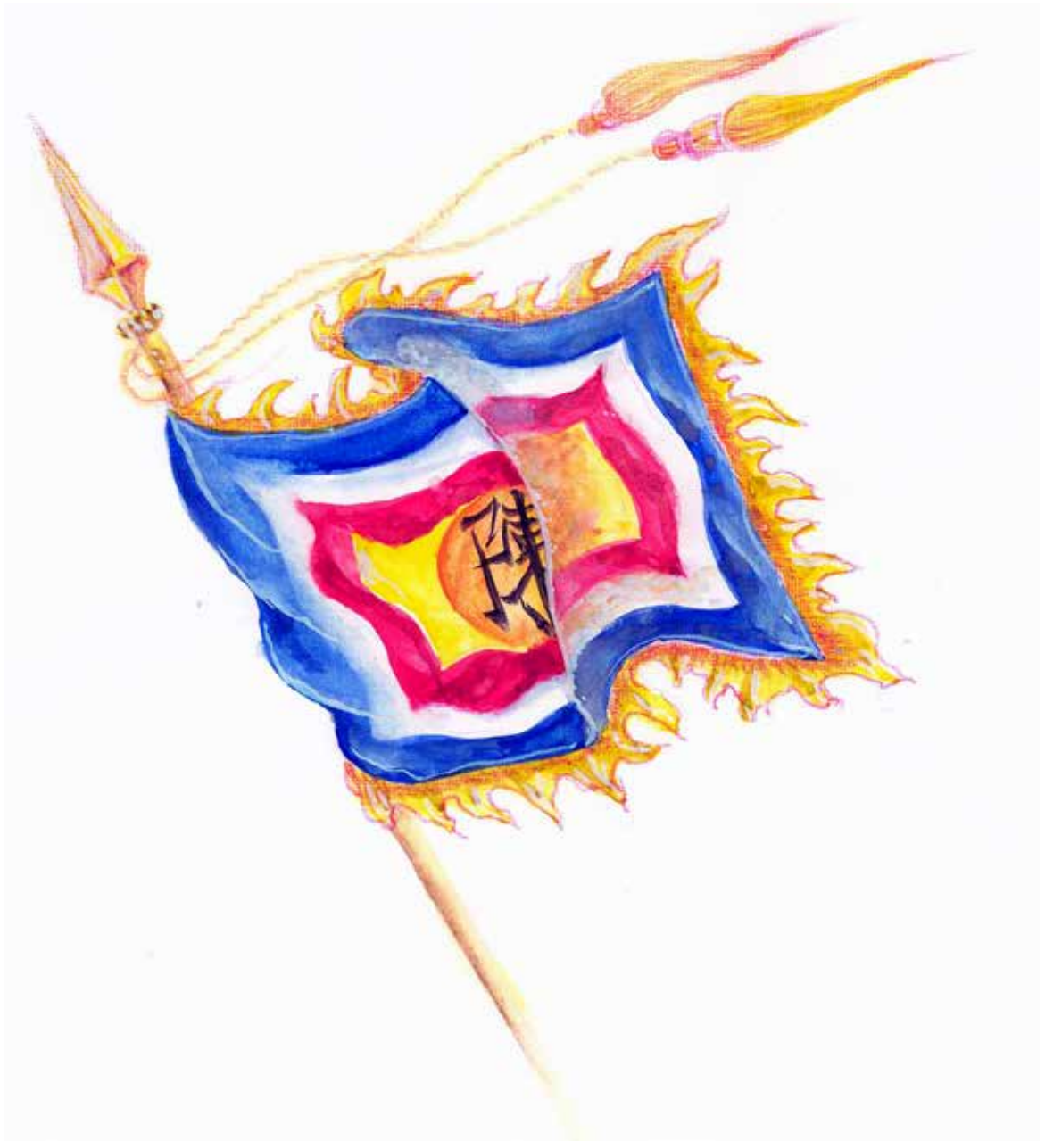
THÁNH-KỲ HẢI-QUÂN VIỆT-NAM