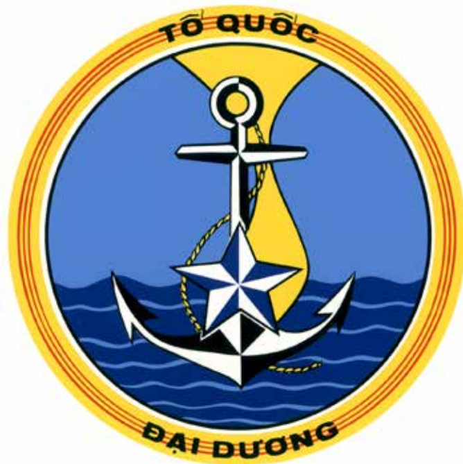
HUY-HIỆU HẢI-QUÂN VIỆT-NAM