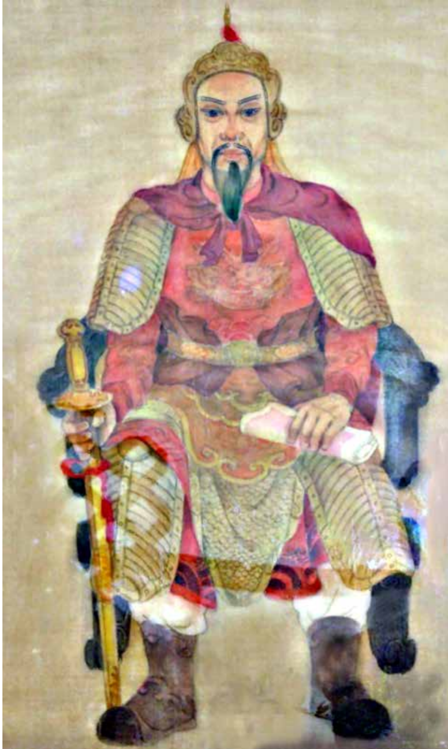
HÙNG-ĐẠO-VƯƠNG TRẦN-QUỐC-TUẤN THÁNH TỔ HẢI-QUÂN VIỆT-NAM