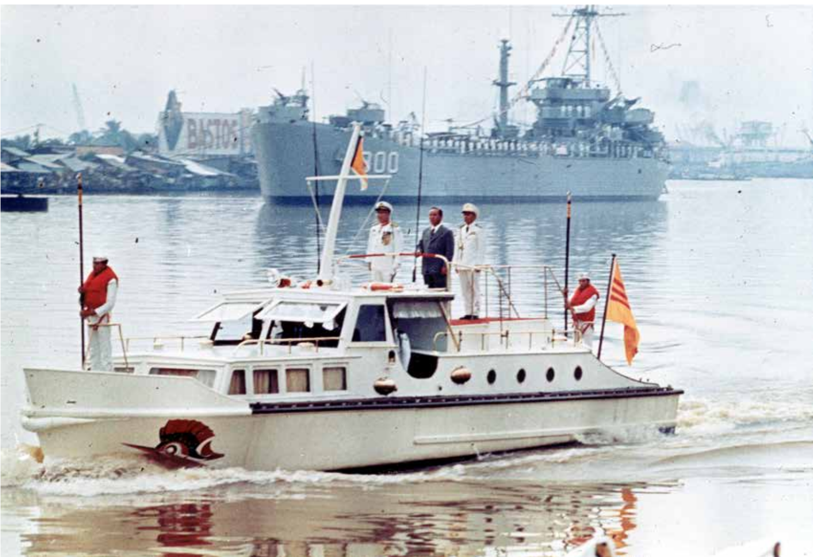
Tổng-Thống Nguyễn-văn-Thiệu và Đô-Đốc Tư Lệnh Hải-Quân duyệt binh