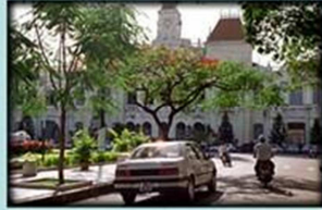
Toà Đô Chính