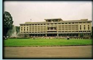
Dinh Độc Lập