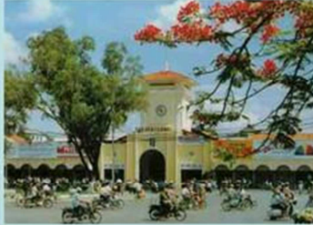
Chợ Bến Thành