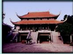
Chùa Vĩnh Nghiêm