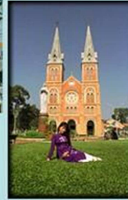
Nhà Thờ Đức Bà