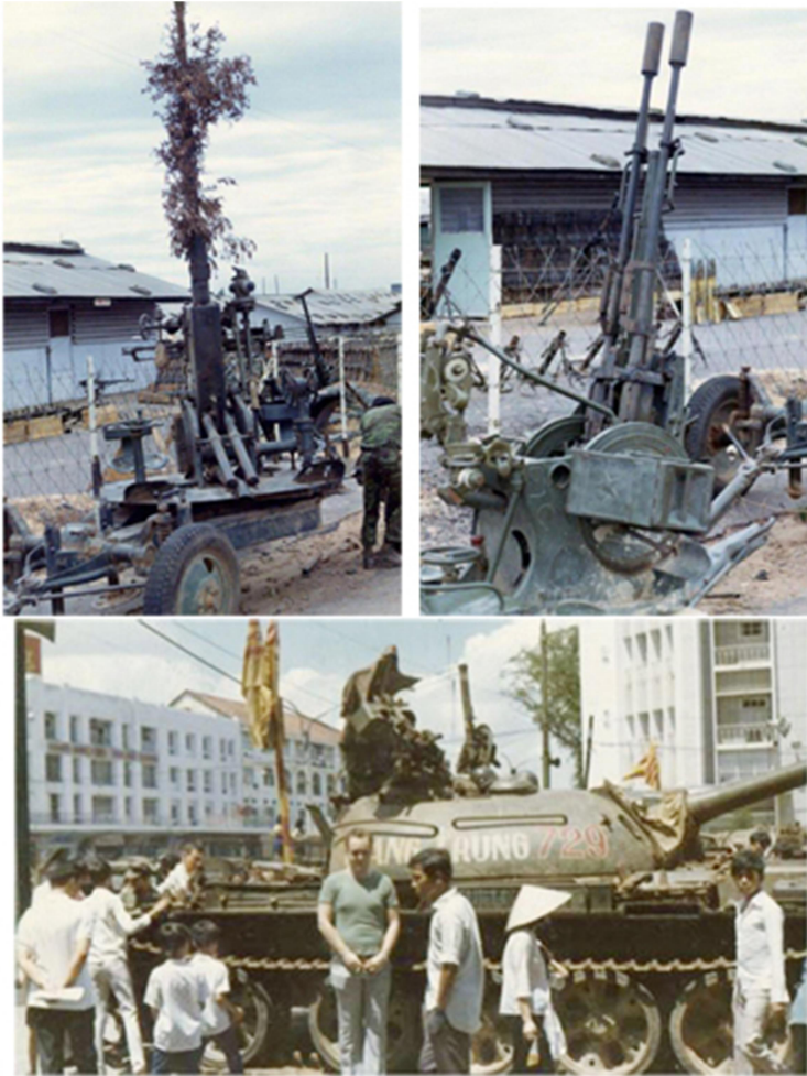
Các vũ khí phòng không và xe tăng của khối Cộng Sản bị QLVNCH tịch thu.

Tựu trung, trở lại đề tài không lực, thì Không Quân Việt Nam đã thi hành nhiệm vụ một cách đáng kính phục trong các trận chiến năm 1972, nhưng vẫn bị giới bình luận Hoa Kỳ hoàn toàn quên lãng. Một chuyên viên điều không tiền tuyến của Hoa Kỳ tỏ ra ngưỡng mộ một phi công A-37 của Việt Nam mà anh ta cùng thi hành một vụ tấn công không lực vào vị trí quân Bắc Việt: