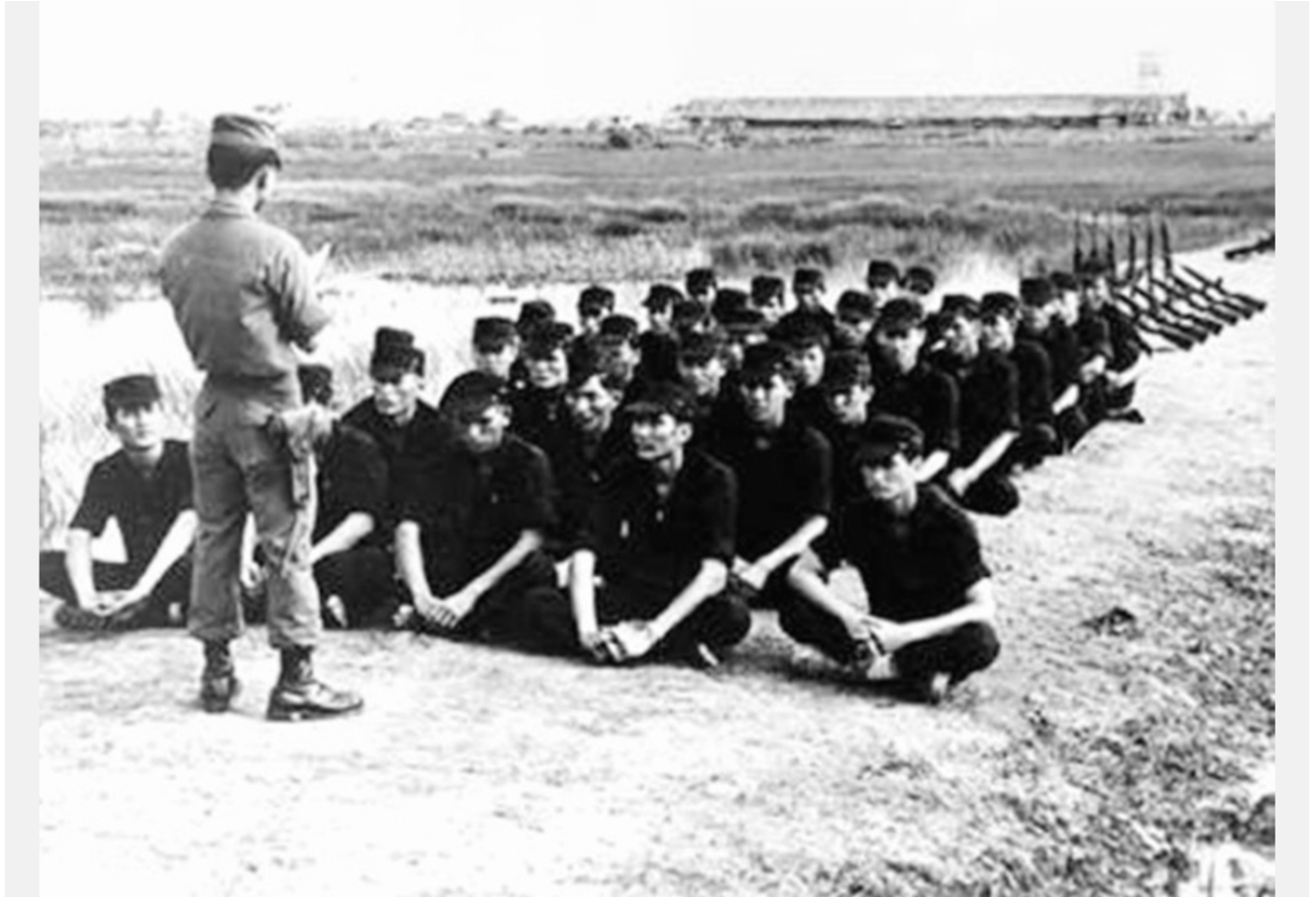
Huấn luyện Nhân Dân Tự Vệ

các đơn vị QLVNCH đã thi triển tài năng để có thể đứng vững và đánh bại quân xâm lược Bắc Việt trong năm 1972, thường là không cần tới sự yểm trợ hỏa lực ồ ạt của pháo binh và không quân chiến thuật, như trong trường hợp của Nghĩa Quân và Địa Phương Quân. Điều có thể nói chắc chắn nữa là sự hiểu biết của người Mỹ về việc này thấp kém đến kinh tởm, thấp tíu mù xa như vực thẳm không đáy.