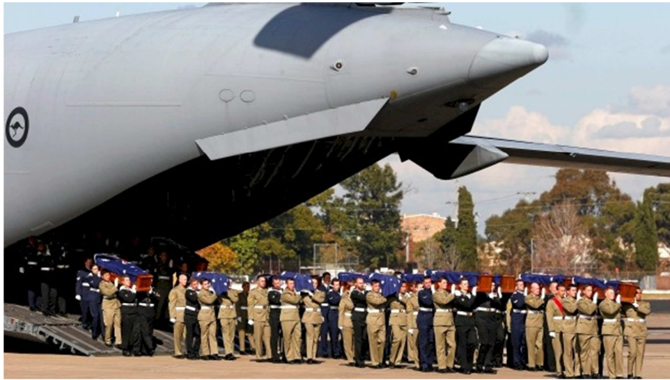
Úc đón tiếp 33 hài cốt Tử sĩ Úc hồi hương ngày 02/6/2016

Qua sự kiện hồi hương tử sĩ Úc này và nhân ngày 18/8/2016 tưởng niệm 50 năm cuộc chiến Long Tân, các cựu Chiến binh Úc từng tham chiến tại Việt Nam đều đã lớn tuổi và không hy vọng còn kéo dài sức khỏe nên đã đề nghị Thủ Tướng Úc Malcolm Turnbull thương thuyết với Chính phủ CsVN chấp thuận cho Chính phủ Úc do Bộ Ngoại Giao và Bộ Cựu Chiến Binh Úc đứng ra tổ chức Lễ Tưởng Niệm đặt vòng hoa và cầu nguyện cho các linh hồn chiến binh Úc hy sinh tại Long Tân. Úc cũng muốn buổi tưởng niệm đó cầu nguyện cho linh hồn của các Bộ đội MTGPMNVN và Bộ đội CS Bắc Việt tham chiến trận Long Tân được an nghỉ. Đây là lần đầu tiên Chính phủ Úc đứng ra tổ chức Lễ Tưởng niệm này nên đã sắp xếp mọi nghi thức, chi phí tốn kém, đưa tất cả số cựu chiến binh Úc và thân nhân tử sĩ Úc đến Việt Nam trước đó 2 ngày để chờ giờ làm lễ vào lúc 3:30PM chiều Thứ Năm 18/8/2016 là giờ mà trận Long Tân cách đó 50 năm bắt đầu nổ súng. Thế nhưng... chiều tối Thứ Tư 17/8/2016 Bộ Ngoại giao CsVN thông báo cấm Úc không được phép tổ chức!