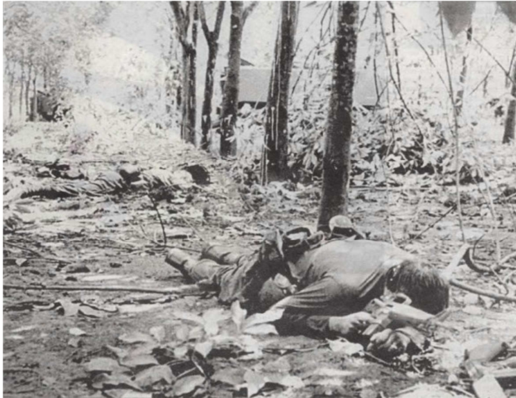
Lính Úc chết trên trận chiến Long Tân ngày 18/8/1966

Tuy nhiên, trong chiến tranh VN, quân đội Úc hầu hết làm về hậu cần, làm công tác dân sự vụ như làm đường, xây dựng nhà cửa giúp dân, khám bệnh. Quân đội Úc rút khỏi Nam Việt Nam vào năm 1970 khi [Trung đoàn] 8 RAR (Royal Australian Regiment) hoàn thành thời gian hoạt động rồi rút về mà không đơn vị nào đến thay thế. Cuộc triệt thoái tiếp tục cho đến ngày 11/01/1973 khi tình hình chiến sự tại Nam Việt Nam sôi sục thì lính Úc đã triệt thoái gần hết cho đến tháng 7/1973. Còn lại một Đại đội canh gác Tòa Đại sứ Úc và di tản hết cùng với các nhân viên dân sự, các hãng thầu Úc và nhân viên Tòa Đại sứ Úc và rút đi trước ngày 30/4/1975 khi Cộng sản Bắc Việt chiếm Sài Gòn. Tổng kết cả quân đội, dân sự, cố vấn, nhà thầu Úc làm việc tại nam Việt Nam là 60,000 người và đã có 521 người bị giết, hơn 3,000 người bị thương.