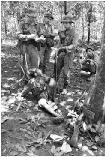
LONG TÂN 18/8/1966

Bộ trưởng Ngoại giao của Úc là bà Julie Bishop kiêm thành viên Quốc hội Úc đã làm việc trực tiếp với Bộ trưởng Ngoại giao CsVN để yêu cầu Việt Nam giữ đúng lời hứa cho phép như đã thảo luận suốt 18 tháng qua mà hai Quốc gia đã thỏa thuận. Nhưng thật xấu hổ vì CsVN nuốt lời cam kết sau khi đã nhận các khoản viện trợ của Úc.