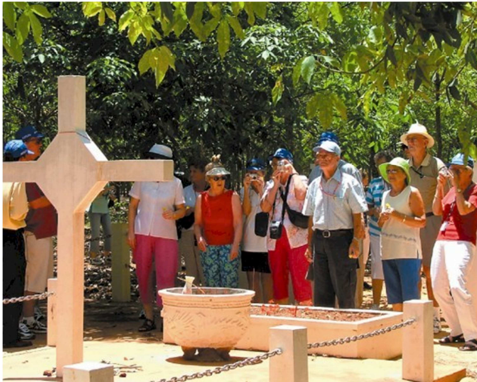
Bia Thánh Giá nguyên thủy bị mất đi nên vào năm 2002 Hội Cựu Chiến Binh Úc tham chiến VN đã lập lại Bia Thánh Giá này cho đến nay