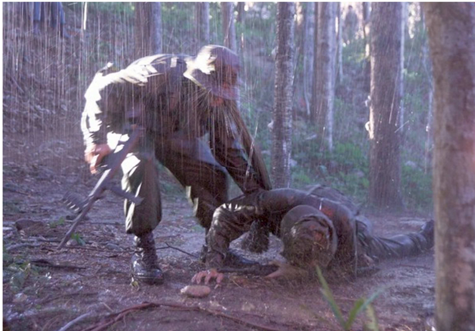
Lính Úc trong trận chiến rừng cao su Long Tân ngày 18/8/1966