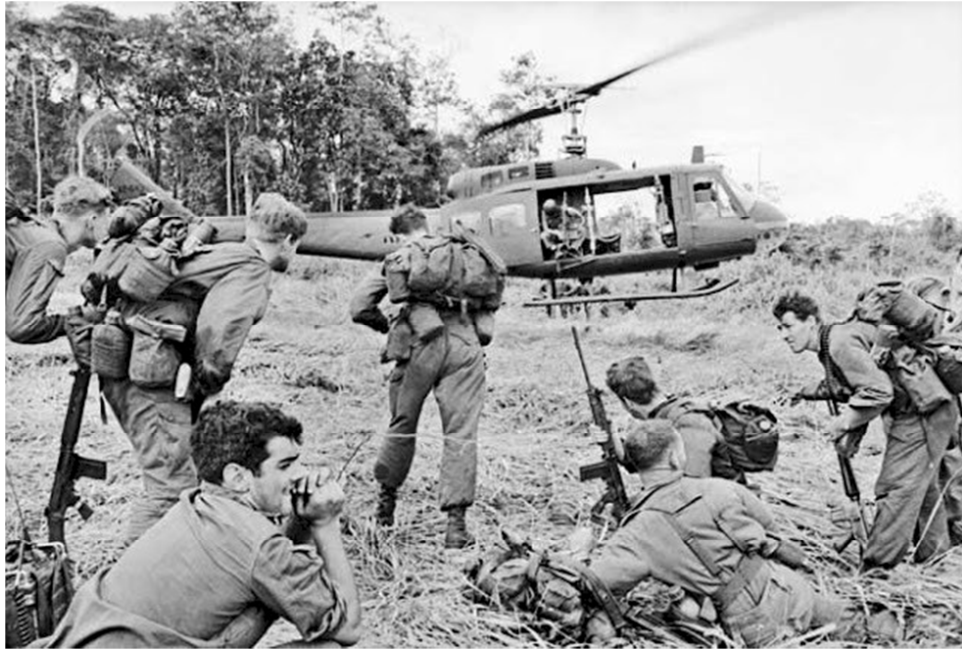
Lính Úc trong chiến trận Long Tân 18 và 19/8/1966

VietPress USA (18/8/2016): Hôm Thứ Năm 18/8/2016 là ngày kỷ niệm 50 năm trận ác chiến xảy ra giữa quân đội Úc Đại Lợi (Australia) giao tranh đẫm máu nhất với Quân Giải Phóng Miền Nam Việt Nam vào hai ngày đêm 18/8 và 19/8/1966 tại rừng cao su thuộc xã Long Tân, huyện Đất Đỏ phía nam Vũng Tàu, Việt Nam.