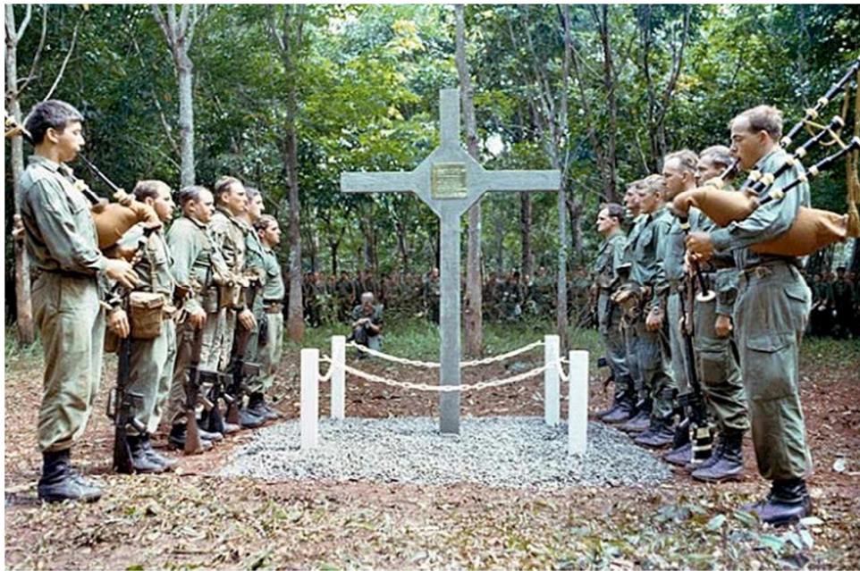
Bia Thánh Giá nguyên thủy do Đại đội D Tiểu đoàn 6 Hoàng Gia Úc dựng lên giữa rừng cao su Long Tân lúc 3:30PM ngày 18/8/1969